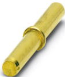
Connection pin, brass, for engaging several base elements to form one unit, 4 units necessary per element

Please be informed that the data shown in this PDF Document is generated from our Online Catalog. Please find the complete data in the user's documentation. Our General Terms of Use for Downloads are valid ( http://phoenixcontact.com/download )