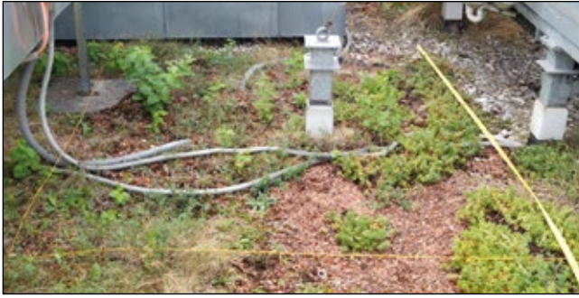
Abb. 13: Fläche zwischen den Aufbauten der Gebäudekühlungs- vorrichtung auf demselben Dach wie Abbildung 12