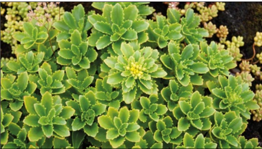
Abb. 6: Sibirische Asienfetthenne ( Phedimus hybridus )