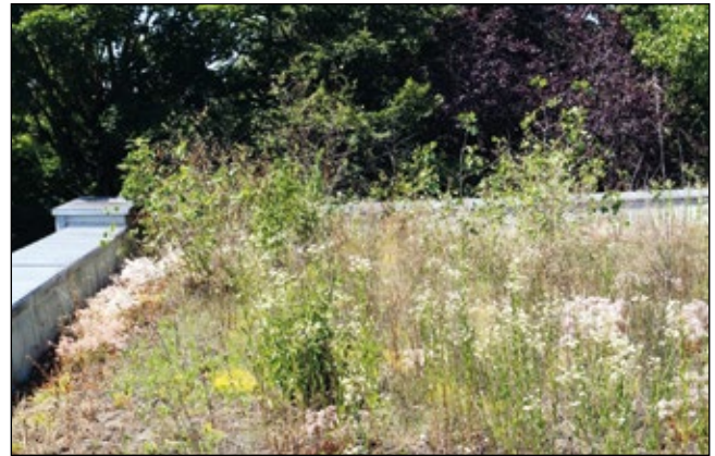
Abb. 16: Dachfläche mit Gehölzen und artenreicher Krautschicht

Höhe der Rotorblätter bleiben (wie zum Beispiel viele Mauerpfefferarten), haben mit nahezu keinen Problemen zu rechnen, wohingegen für all jene die darüber hinauswachsen ein existenziell gefährdender Zustand eintritt. Das Hauptziel jeder Pflanze ist die Vermehrung, welche meist über die Anlage von speziell dafür ausgerichteten Organen vollzogen wird, von denen die meisten eher in den höheren Pflanzenregionen angebracht sind, weil dies den Verbreitungsradius begünstigt. Werden sie entfernt oder beschädigt, versucht jede Pflanze neue Organe zu bilden, was aber durch die nun verkürzte Vegetationsperiode zu einer Stresssituation führt. Unter den harschen Bedingungen auf den Dachflächen ist dies oft aber nur bedingt möglich, vor allem auch weil mit den nachfolgenden Monaten Juni, Juli und August die entbehrungsreichste Zeit des Jahres anbricht. In diesen Monaten ist von reduzierten Niederschlagszahlen und extremen Temperaturwerten auszugehen. Viele Pflanzen sind diesen Situationen nicht gewachsen und verenden, wodurch die Verbreitung de facto unterbunden wird.