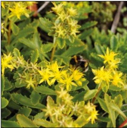
Abb. 11: Hummel bei der Nektarsuche