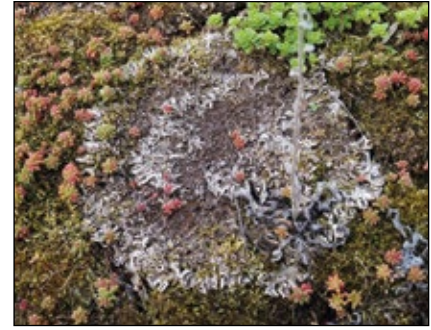
Abb. 10: Flechtenpolster