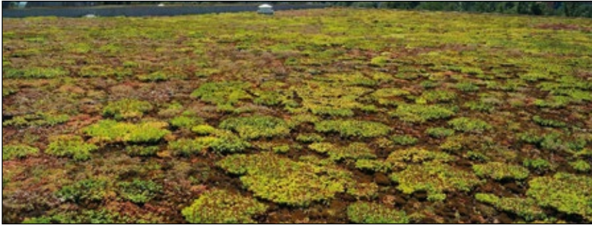
Abb. 9: Dicht bewachsenes Gründach. Bei den braunen Stellen zwischen den grünen Pflanzenpolstern handelt es sich um Moose.