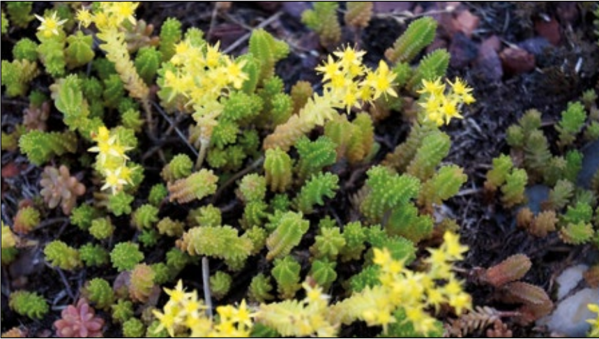
Abb. 5: Milder Mauerpfeffer ( Sedum sexangulare )