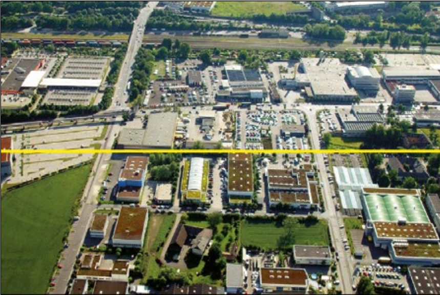
Abb. 2: Vergleich von Gebäuden mit Baudatum vor 1985 und nach 1985. Die Gebäude über der gelben Linie wurden vor 1985 gebaut, als es noch keine Begrünungsvorschrift gab. Die Gebäude darunter wurden nach 1985 errichtet, als diese bereits existierte.