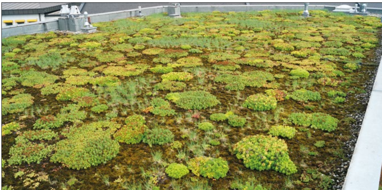
Abb. 1: Bunte Dachbegrünung auf einem Firmengebäude

Felling 1 A-4644 Scharnstein gregor.auinger@edu.uni-graz.at