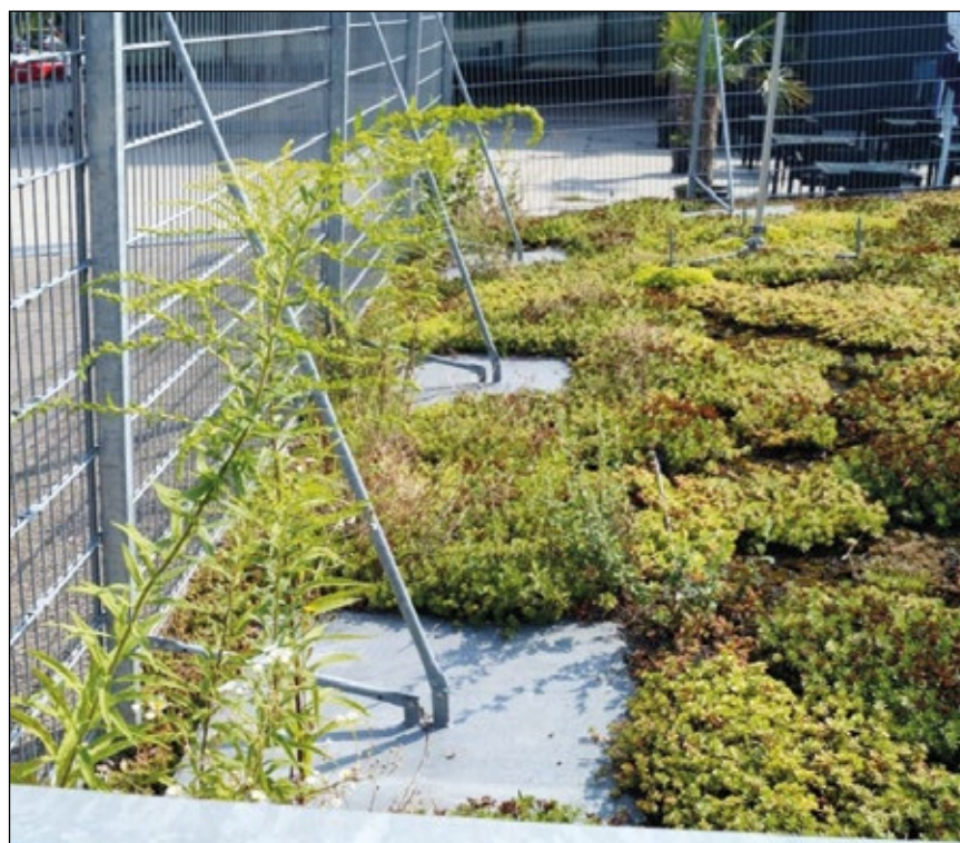
Abb. 7: Solidago canadensis am Randbereich eines Daches. Die Pflanze wächst höchstwahrscheinlich dort, weil die Rotorblätter des Rasenmähers dieses Gebiet nicht erreichen.