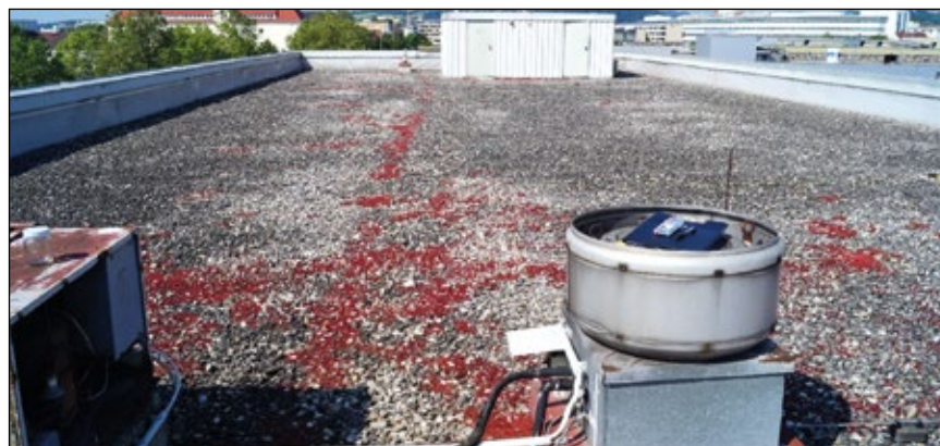
Abb. 8: Neophytenfreies Kiesdach mit Sedum album -Bewuchs