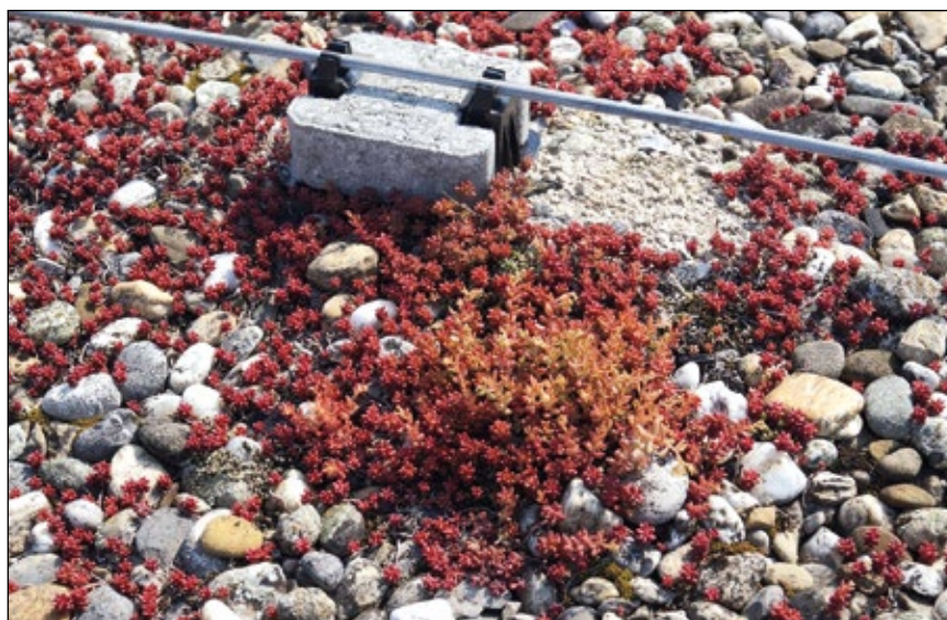
Abb. 4: Weißer Mauerpfeffer ( Sedum album ) auf einem Kiesdach.