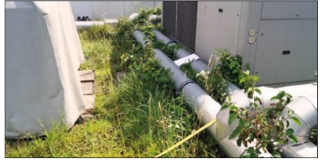
Abb. 14: Rückzugsorte zwischen Kühl- und Lüftungsvorrich- tungen