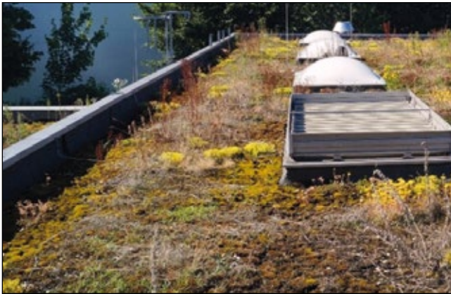
Abb. 15: Dachfläche mit artenreicher Krautschicht