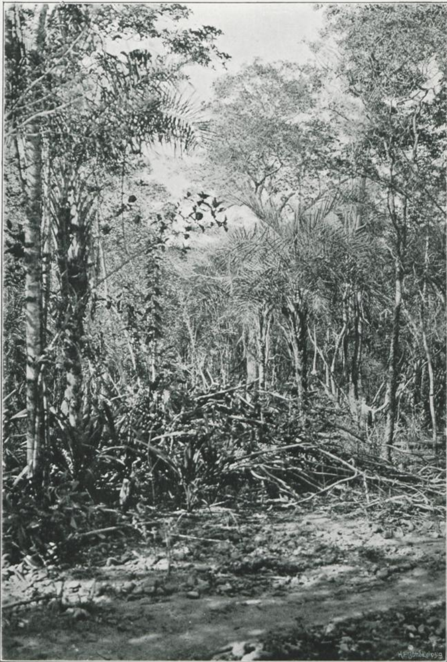
Cocos coronata Mart. und Manihot dichotoma Ule in der Catinga bei Tambury. Oktober 1906.