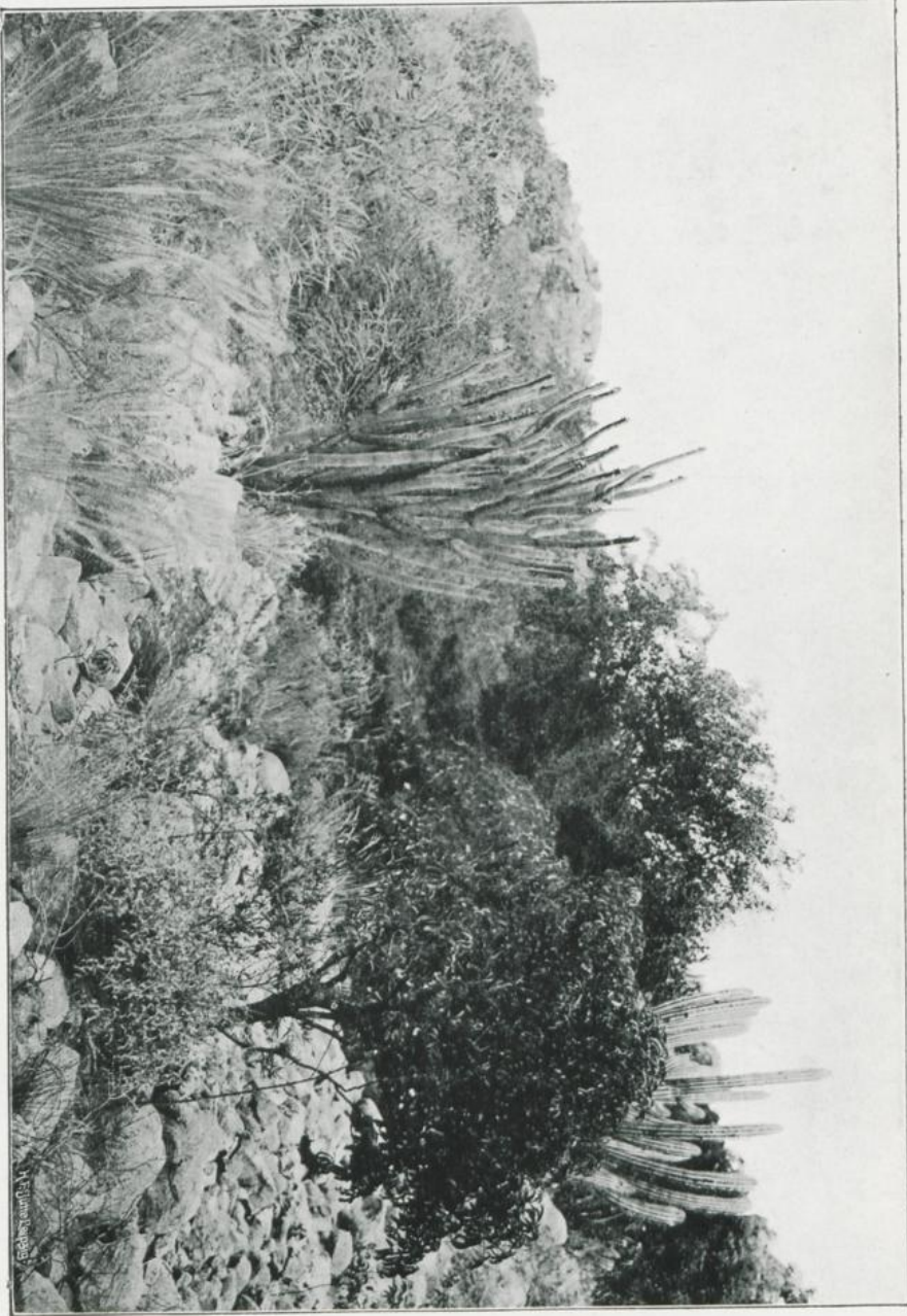
Manihot heptaphylla Ule, Cephalocereus Ulei Gürke, Trachypogon montifari (Kth.) Nees und Turnera stenophylla Urb. in der Serra do São Ignacio. Februar 1907.