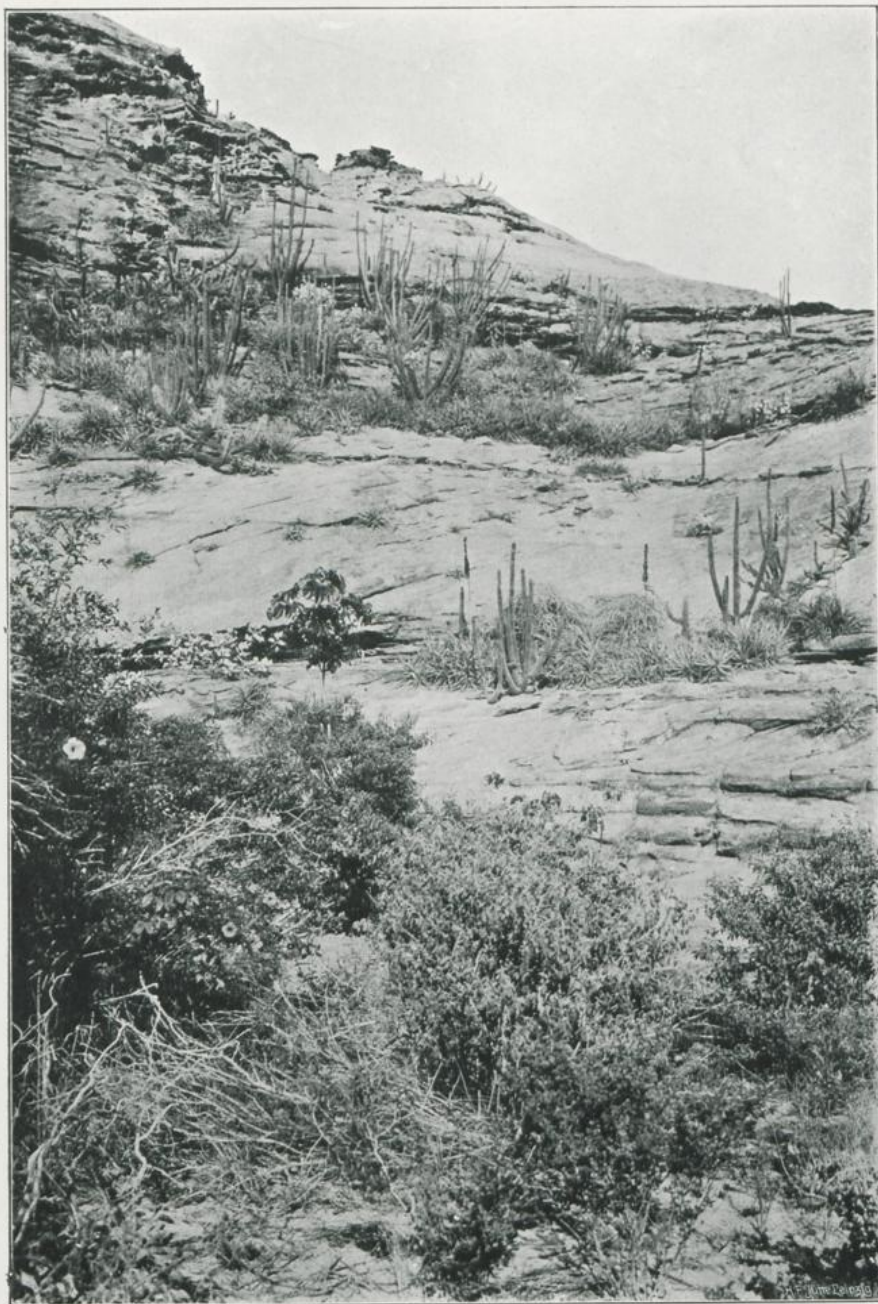
Encholirion spectabile Mart., Eremanthus Martii Bak., Cereus squamosus Gürke, Cecropia sp. und Allamanda puberula A. DC. in der Serra Branca in Piauhy. Januar 1907.