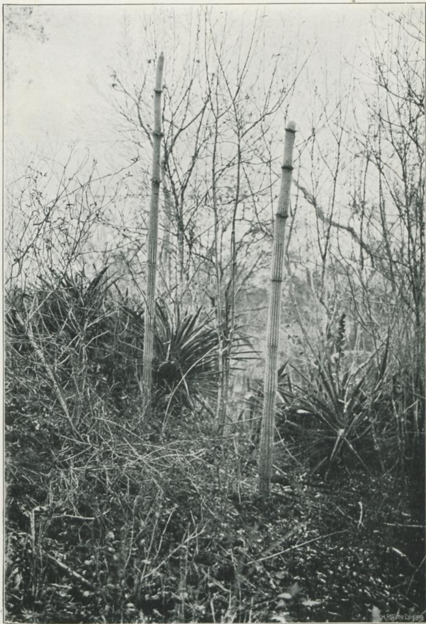
Cercus Catingae Ule und Hohenbergia leucostele Gürke in der Catinga bei Calderão. Oktober 1906.