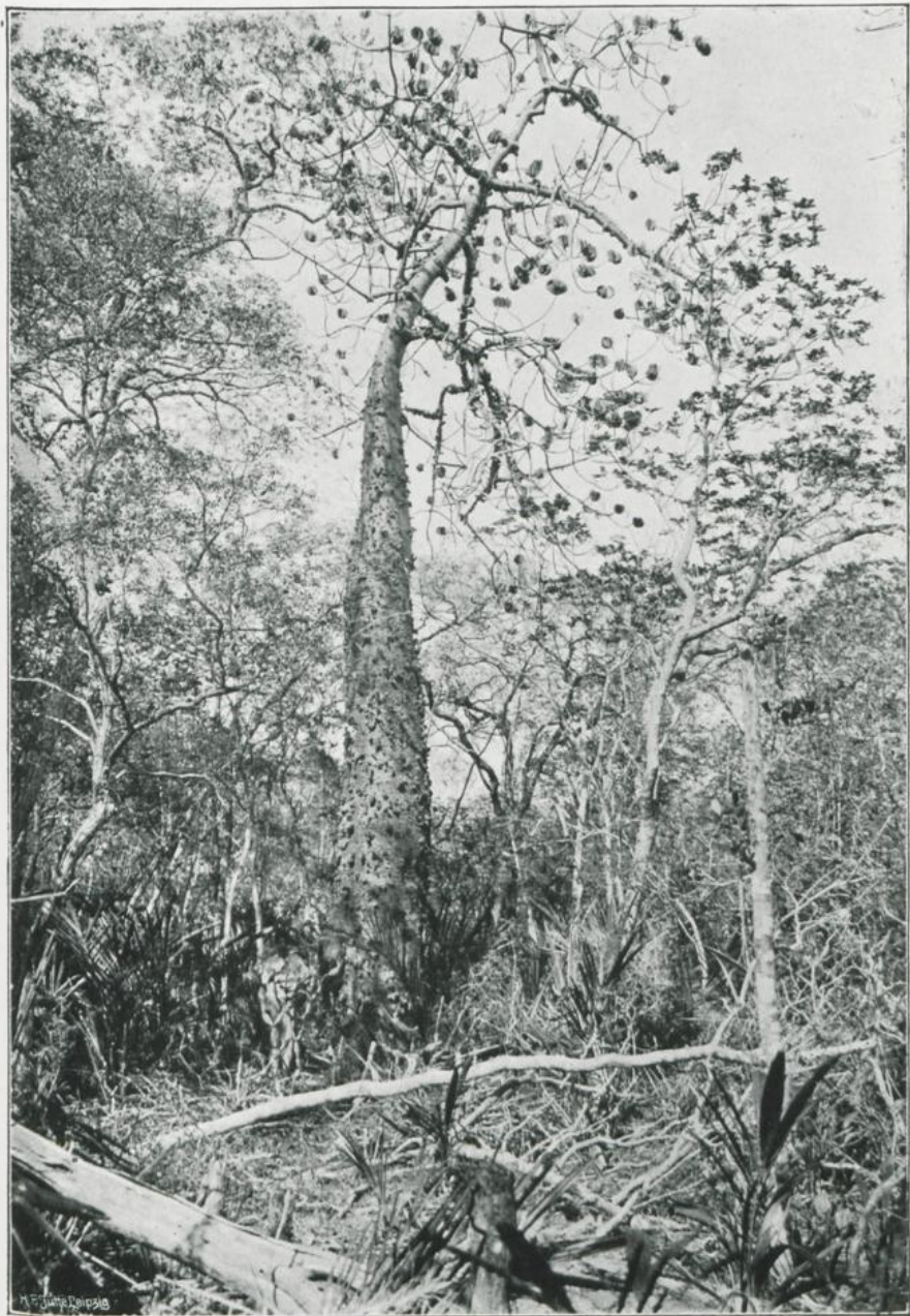
Caranillesia arborea K. Sch. und Machaerium sp. in der Catinga bei Tambury. Oktober 1906.