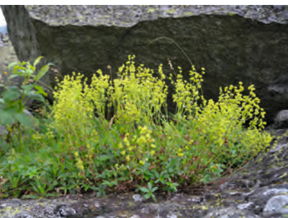
Abb. 8: Alchemilla saxatilis : Kt. Uri, Gde. Hospental, Gamssteg, 1620 m, alpine, steinige Weide. 26. 7. 2010

kleinen Individuenzahlen auftreten, wie auch umgekehrt. Bei Sippen mit auffälliger Diskrepanz zwischen Verbreitung und Häufigkeit wird dies erwähnt. Bei sehr seltenen Arten (Verbreitungsklasse I) werden die Fundorte einzeln und mit ihrer Gemeindezugehörigkeit genannt.