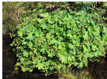
Abb. 11: Alchemilla longiuscula ; Kt. Uri, Gde. Realp, Isenmannsalp, 2195 m, in Sümpfen und an Bächen. 9. 9. 2015