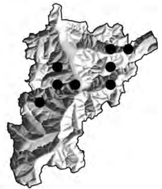
Abb. 7: Verbreitungskarte, Kanton Uri: Alchemilla grossidens