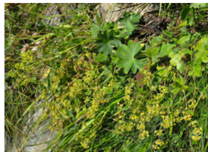
Abb. 10: Alchemilla infravallesia ; Kt. Uri, Gde. Unterschächen, Sittlisalp, 2038 m, steiniger Steilhang. 16. 8. 2011