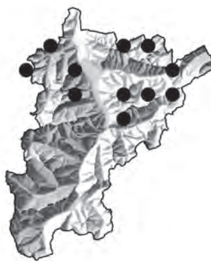
Abb. 3: Verbreitungskarte, Kanton Uri: Alchemilla amphisericea