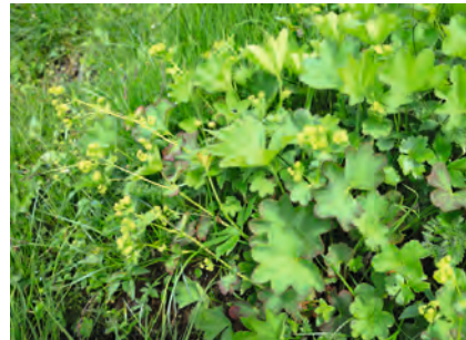
Abb. 9: Alchemilla curtiloba ; Kt. Uri, Gde. Andermatt, Hintere Felli, 2060 m, moorige, überrieselte Wiese. 8. 8. 2014