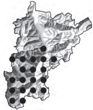
Abb. 4: Verbreitungskarte, Kanton Uri: Alchemilla alpina

Abb. 2: Tektonische Übersichtskarte des Kantons Uri. Im Süden des Kantons Uri liegen vorwiegend kristalline silikatreiche Gesteine mit saurer Reaktion (rot). Im nördlichen Teil überwiegen Sedimentgesteine aus Kalk und Sandstein mit eher basischer Reaktion (grün, gelb) (aus SPILLMANN 2011, verändert nach SCHMID et al. 2004).