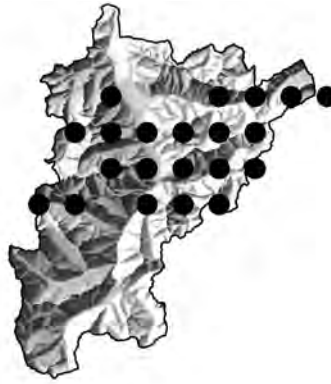
Abb. 6: Verbreitungskarte, Kanton Uri: Alchemilla glacialis