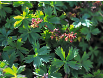
Abb. 13: Alchemilla spec. nov. : Kt. Uri, Gde. Unterschächen, Chammlisiten, 2085 m, steinige, alpine Weide. Eine von mehreren noch neu zu beschreibenden Arten. 29. 8. 2011