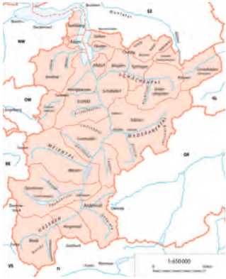
Abb. 1: Geografische Übersichtskarte des Kantons Uri (nach Daten der LISAG Uri), aus SPILLMANN et al. 2011, verändert.