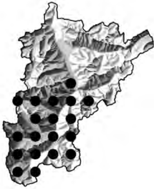
Abb. 5: Verbreitungskarte, Kanton Uri: Alchemilla saxatilis