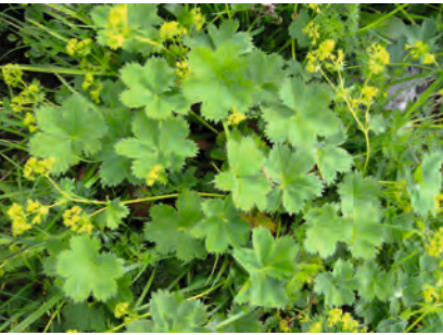
Abb. 12: Alchemilla weberi : Kt. Uri, Gde. Silenen, Etlital, Müllersmatt, 2050 m, alpine, steinige Weide. 28. 7. 2010