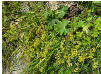
Abb. 10: Alchemilla infravallesia ; Kt. Uri, Gde. Unterschächen, Sittlisalp, 2038 m, steiniger Steilhang. 16. 8. 2011