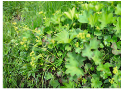
Abb. 9: Alchemilla curtiloba ; Kt. Uri, Gde. Andermatt, Hintere Felli, 2060 m, moorige, überrieselte Wiese. 8. 8. 2014