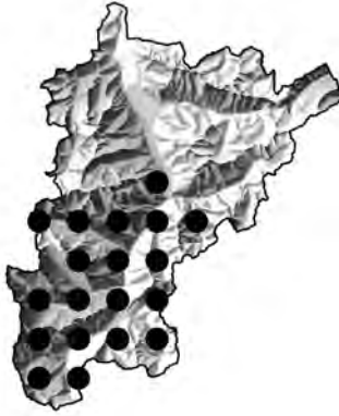
Abb. 5: Verbreitungskarte, Kanton Uri: Alchemilla saxatilis