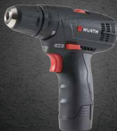
ACCU BOOR-SCHROEFMACHINE BS 12-A