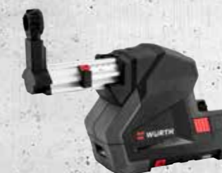
ACCU STOFAFZUIGSTELSYSTEEM ASA 18 COMPACT