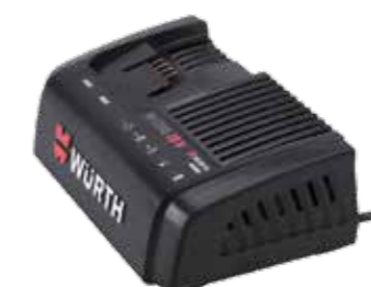
LAADAPPARAAT ALG 18/6 FAST Art.nr. 5705 860 000