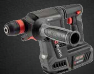
ACCU BOORHAMER ABH 18 COMPACT