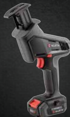
ACCU SCHROBZAAGMACHINE AFS 12 COMPACT M-CUBE