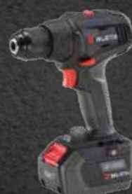
ACCU BOOR-SCHROEFMACHINE ABS 18 COMPACT