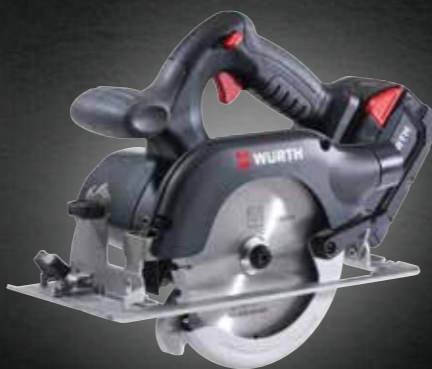
ACCU HANDCIRKELZAAGMACHINE HKS 28-A