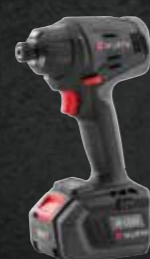
ACCU SLAGSCHROEFMACHINE ASS 18-1/4 INCH COMPACT