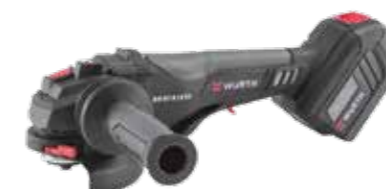
ACCU HAAKSE SLIJPMACHINE AWS 18-125 P COMPACT