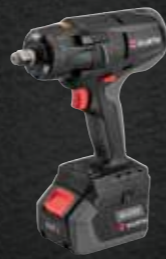
ACCU SLAGMOERSLEUTEL ASS 18-1/2 INCH COMPACT