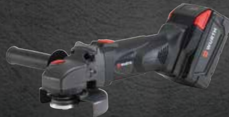
ACCU HAAKSE SLIJPMACHINE EWS 28-A