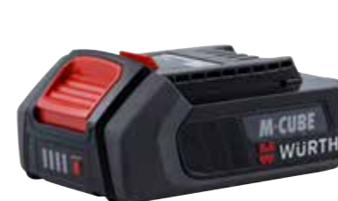
ACCU LI-ION 18 V BASIC, 2,0 AH Art.nr. 5703 420 000