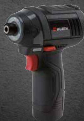
ACCU SLAGSCHROEFMACHINE ASS 12-A