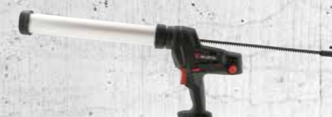
ACCU KITPISTOOL AKP 18-600