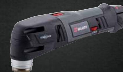
ACCU MULTITOOL MS 12-A