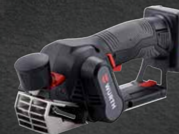
ACCU SCHAAFMACHINE HO 12-A