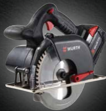
ACCU METAALHANDCIRKELZAAG- MACHINE MHKS 28-A