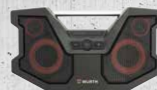
ACCU BLUETOOTH SPEAKER BTS 18-40