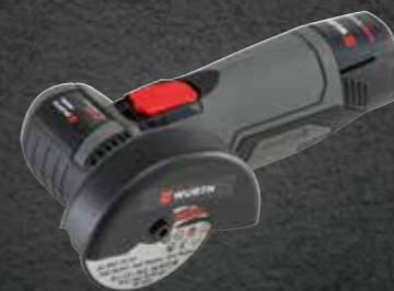
ACCU SLIJPMACHINE TG 12-A