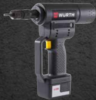
ACCU BLINDKLINKMOEREN- MACHINE ANG 310