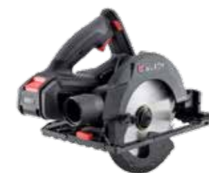
ACCU HANDCIRKELZAAGMACHINE AHKS 18-68 COMPACT