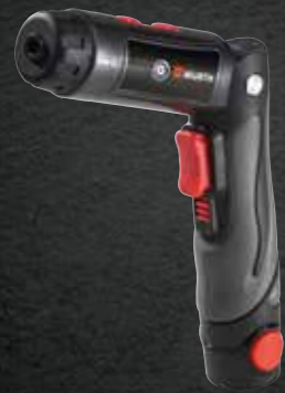
ACCU SCHROEFMACHINE S 3-A