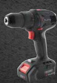
ACCU BOOR-SCHROEFMACHINE ABS 18 BASIC