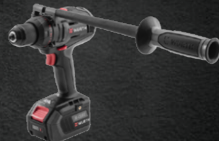
ACCU BOOR-SCHROEFMACHINE ABS 18 POWER