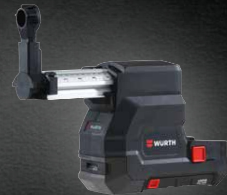
STOFAFZUIGING VOOR BOORHAMER H 28-MA(S)