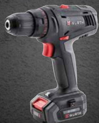
ACCU BOOR-SCHROEFMACHINE ABS 12 COMPACT M-CUBE