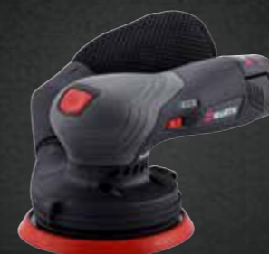
ACCU EXCENTRISCHE SCHUURMACHINE ETS 12-125-A