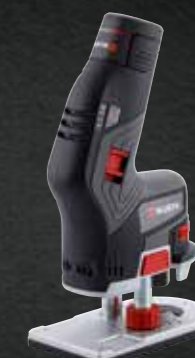
ACCU KANTENFREEMACHINE KF 12-A