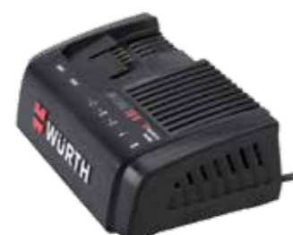
LAADAPPARAAT 18/4 BASIC Art.nr. 5705 180 000