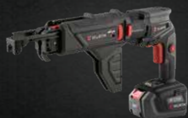
ACCU SNELBOUWSCHROEFMACHINE ATS 18 AUTOMATIC