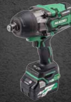
ACCU SLAGMOERSLEUTEL HIKOKI WR 36DA