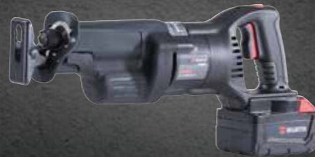
ACCU SCHROBZAAGMACHINE SBS 28-A