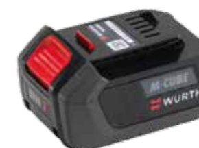
ACCU LI-ION 18 V BASIC, 5,0 AH Art.nr. 5703 450 000