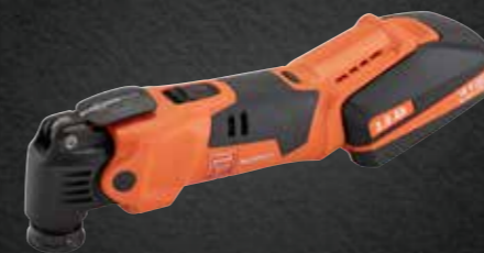
ACCU MULTITOOL AMM 500