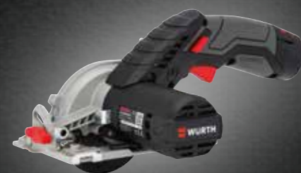
ACCU HANDCIRKELZAAGMACHINE HKS 12-A