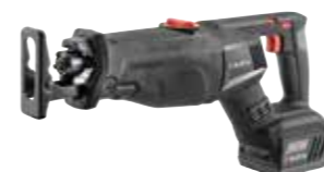
ACCU SCHROBZAAGMACHINE AFS 18 COMPACT