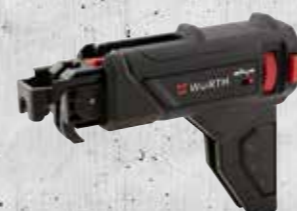
SCHROEFVOORZETSTUK MSV 55-TS