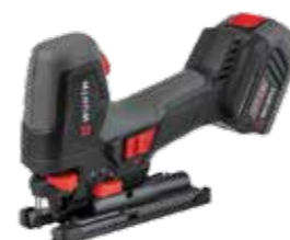
ACCU DECOUPEERZAAGMACHINE APS 18 COMPACT