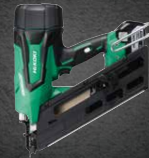
ACCU SPIJKERPISTOOL HIKOKI NR 1890DBCL