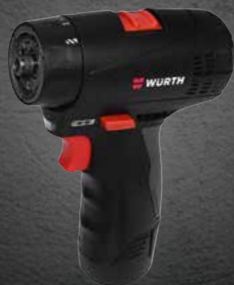
ACCU BOOR-SCHROEFMACHINE BS 12-A MULTI