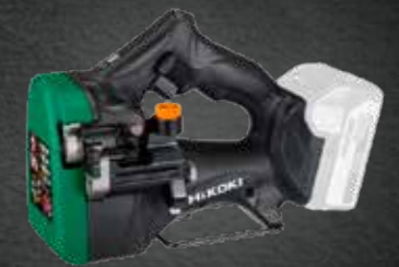
ACCU DRAADEINDKNIPPER HIKOKI CL 18 DSL