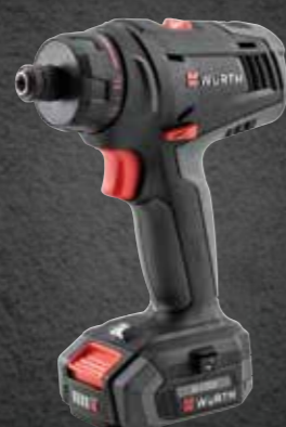
ACCU SCHROEFMACHINE AS 12 COMPACT M-CUBE