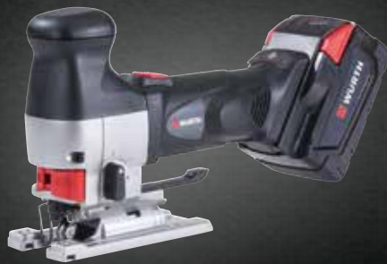
ACCU DECOUPEERZAAGMACHINE STP 28-A