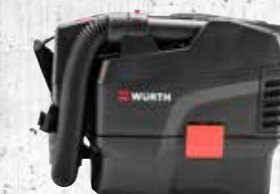
ACCU DROOGSTOFZUIGER AMTS 18 L COMPACT