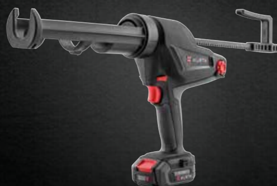
ACCU KITPISTOOL AKP 12 COMPACT M-CUBE