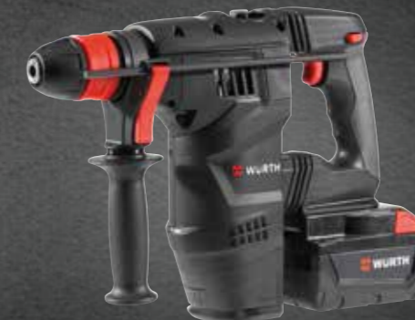
ACCU BOORHAMER TRILLINGSARM H 28-MAS