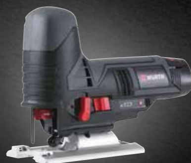
ACCU DECOUPEERZAAGMACHINE STP 12-A