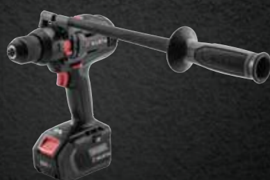
ACCU KLOPBOOR-SCHROEFMACHINE ABS 18 POWER COMBI