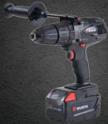
ACCU KLOPBOOR-SCHROEFMACHINE BS 28-A COMBI