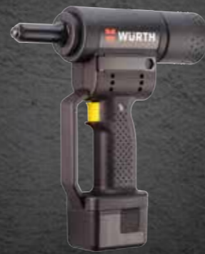
ACCU BLINDKLINKNAGEL- MACHINE ANG 14