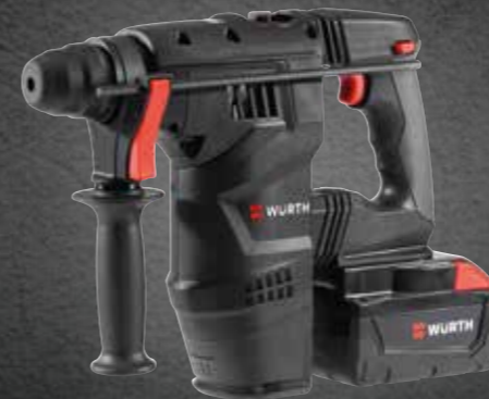
ACCU BOORHAMER TRILLINGSARM H 28-MA