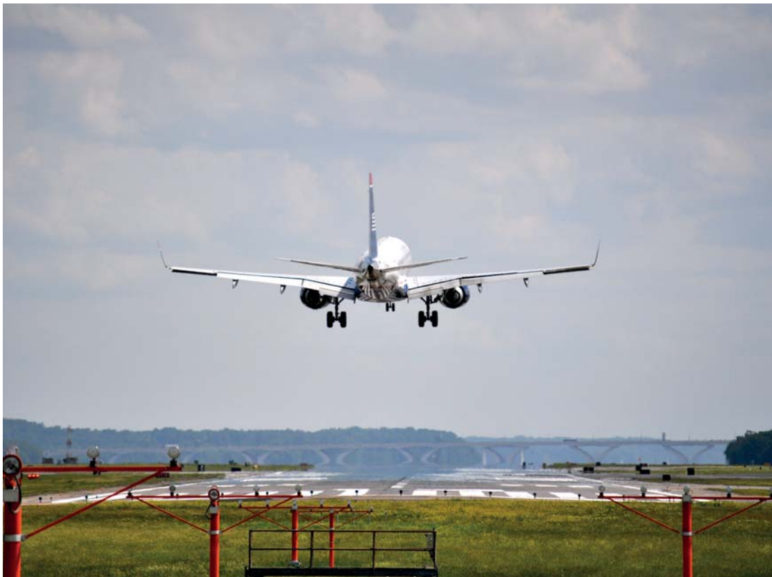
De nieuwe routes kunnen misschien voor extra geluidsoverlast zorgen.