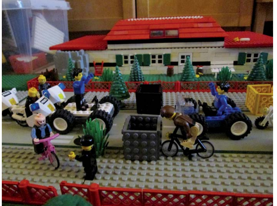
Tegen de bloembakken levert veel creatieve bijdragen op, zelfs in Lego.

Plaatsen waar de formulieren afgehaald en ingeleverd kunnen worden zijn: Vakgarage Richtlijn, E. Mooylaan 1, Kortenhoeve; Zeldenrust Autoschade, Machineweg 42a, Nederhorst den Berg; Bandenmaat Cannenburgerweg 2b, Ankeveen; Autobedrijf van de Bilt Cannenburgerweg 55, Ankeveen; Blokker Meenthof Kortenhoeve (alleen inleveren bij de kassa).