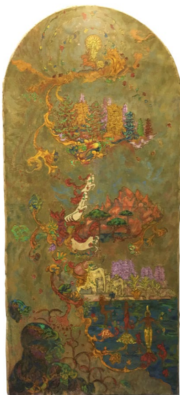
Les dons de Janaka - 1914 détrempe sur toile

En 2019, deux œuvres phares de l'artiste Richard Burgsthal, ami de Gustave Fayet, émule d'Odilon Redon et auteur des superbes vitraux de l'Abbaye de Fontfroide, sont venues enrichir les collections de Béziers. La présence d'un dépôt