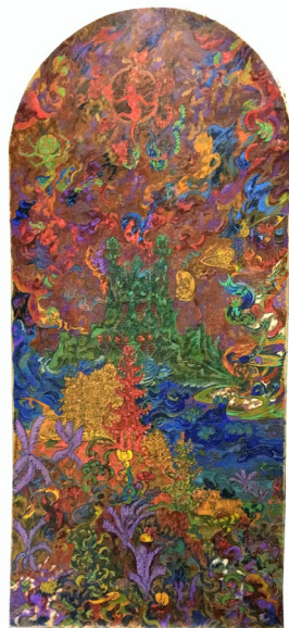
La ville de la magie Yadjnvalkya - 1914

de près de 4000 pièces à Béziers a plaidé en faveur de cette acquisition. Le diptyque, récemment restauré, viendra illuminer de sa riche palette de couleurs les salles du futur Musée de Béziers.