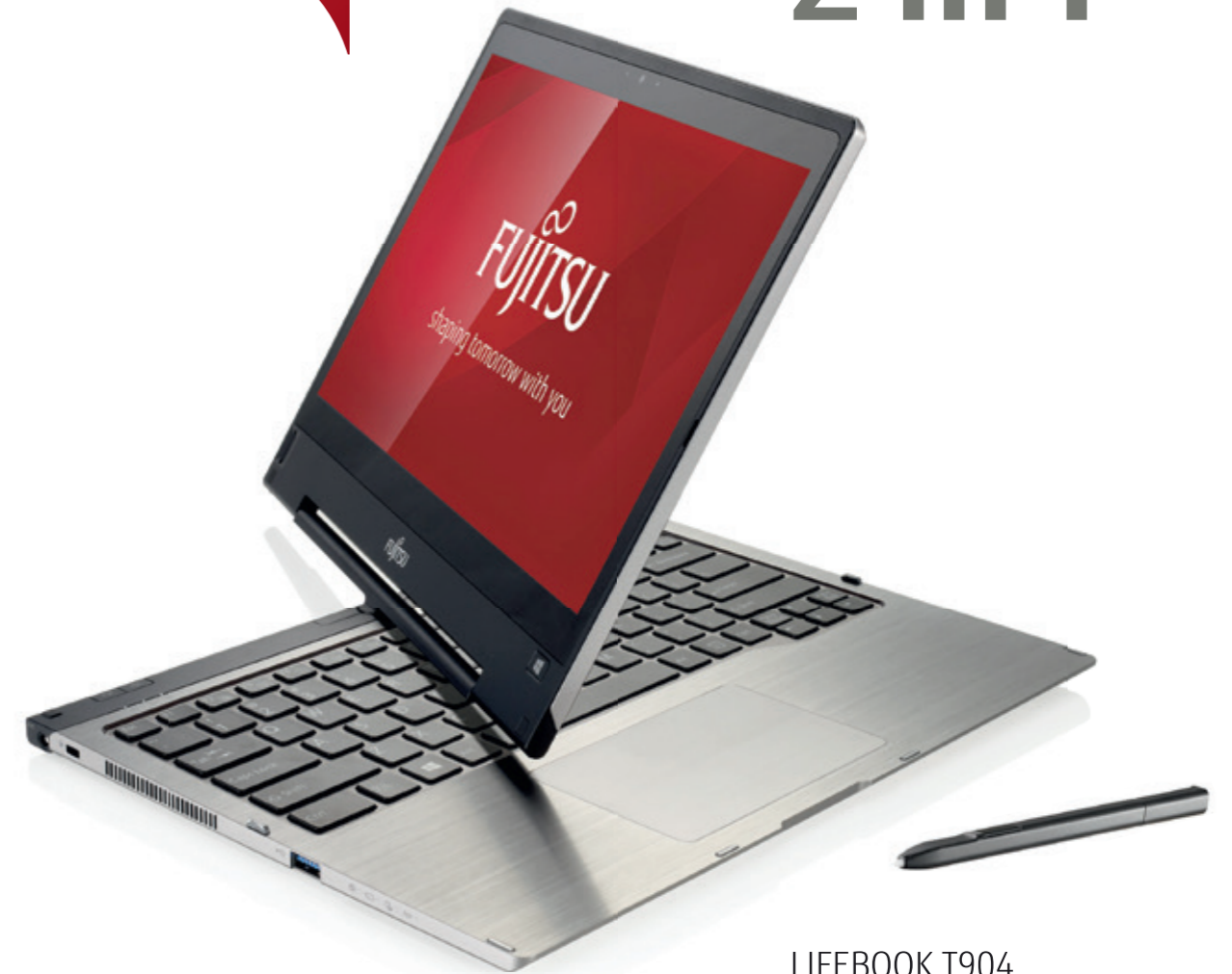
LIFEBOOK T904 Ultrabook neu definiert Seite 9

click → fujitsu.com/ch call → 058 258 80 28