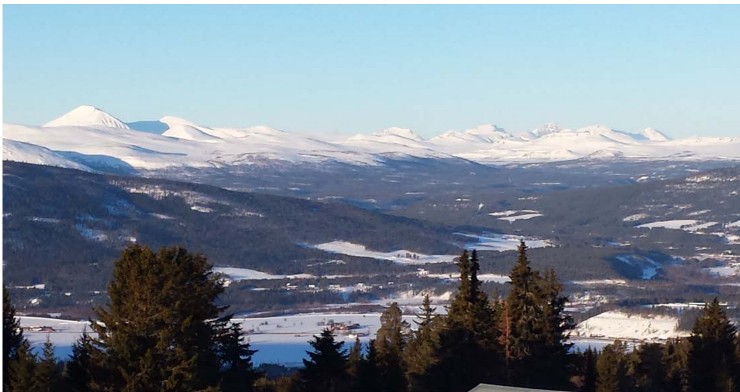
Panorama over Alvdal med Sølnekletten og Rondane i bakgrunnen, sett fra Tronsvangen 30.03.2018.

Etter nesten tre år med for det meste bare utgifter, og til dels veldig store utgiftsposter, er det godt for balansen i økonomien endelig å kunne få litt inntekter. Den store etterspørselen etter leie av rom gir håp om en økonomisk sunn drift fremover. Driftskostnadene er høye, og enda trengs flere større investeringer for å få den nødvendige driftsstandard som kreves. Målet er at vi kan ha minst fem eller seks betalende fastboende, som mer eller mindre dekker de månedlige faste utgiftene, slik at vi i mindre grad trenger å være avhengig av tilfeldige besøkende. På den måten vil vi også få større spillerom for å utvikle de aktivitetene vi egentlig ønsker å ha på Tronsvangen Seter.