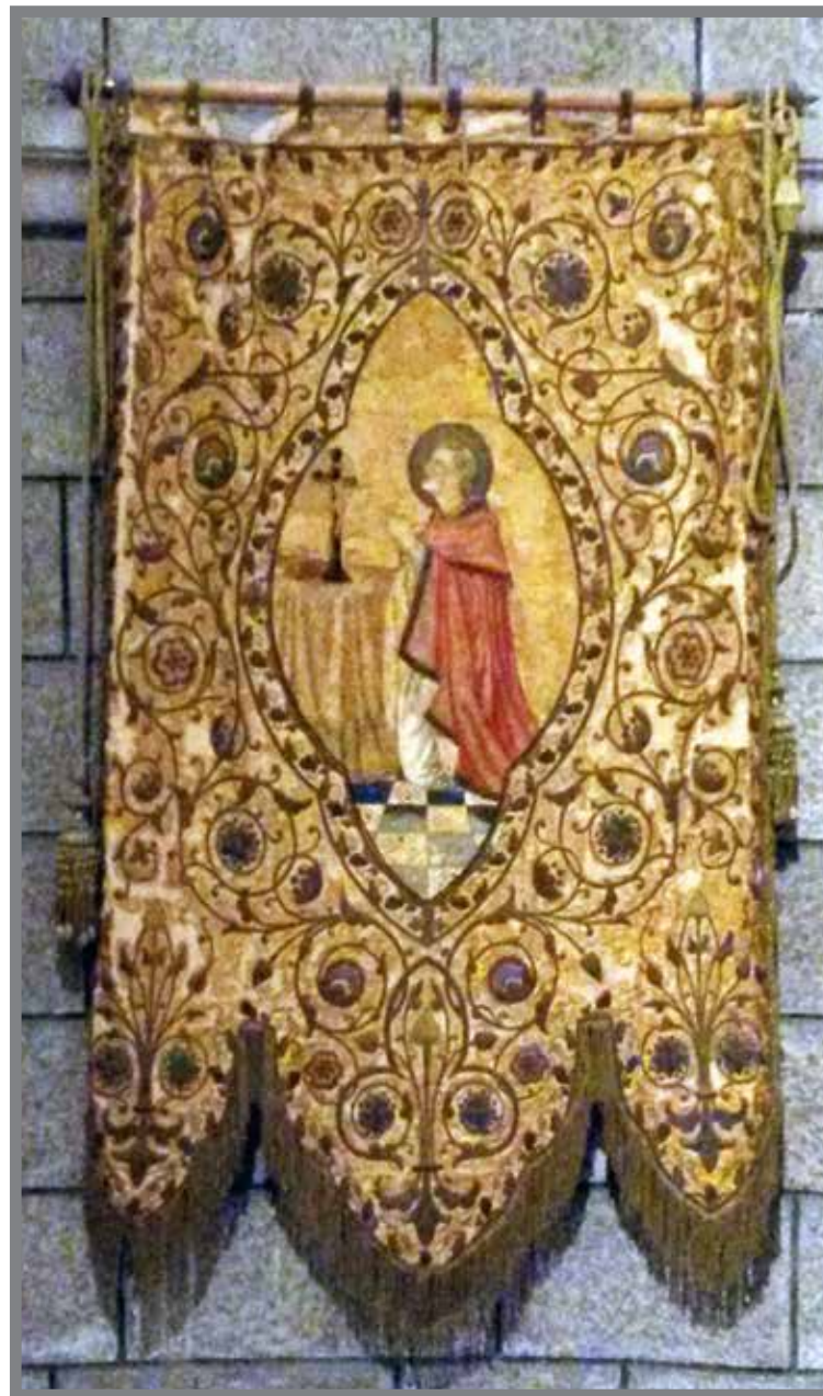
■ Gonfalon de la Congrègation de l'Immaculée Conception : Saint Charles Borromée

Pourquoi Guillaume, jusqu'en 1897 élève modèle, a-t-il abandonné ses études ? On ne peut qu'émettre des hypothèses sur cette crise profonde. Peut-être rejette-t-il le monde conformiste dans lequel on a voulu le tenir enfermé ? Ce précurseur du surréalisme dont il a forgé le nom n'a pas laissé beaucoup de traces de sa période monégasque. Tout récemment Pierre Bergé bibliophile averti a permis l'édition d'un album 4 du jeune Guillaume jusque là inédit couvrant la période de 1893-1895 où se mêlent poèmes et dessins.