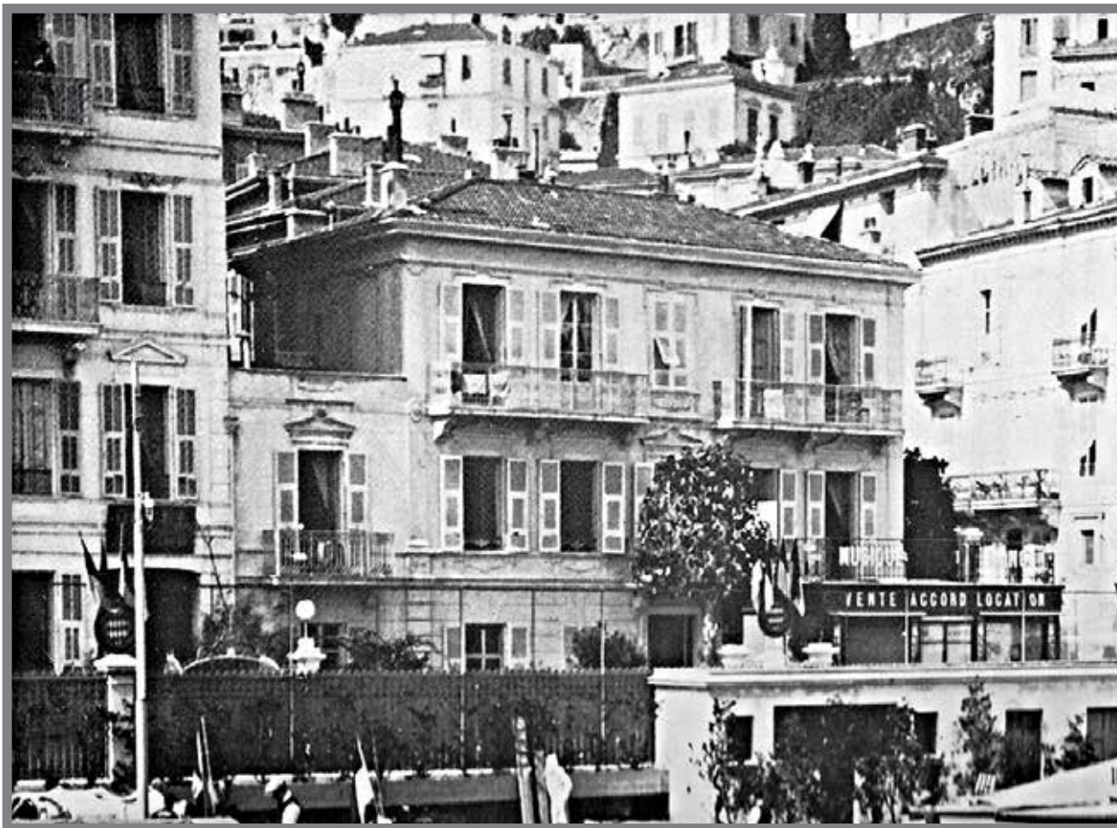
■ La maison Canis au coin des rues Louis Notari et Princesse Antoinette. La famille Apollinaire habitait au 2ème étage à droite