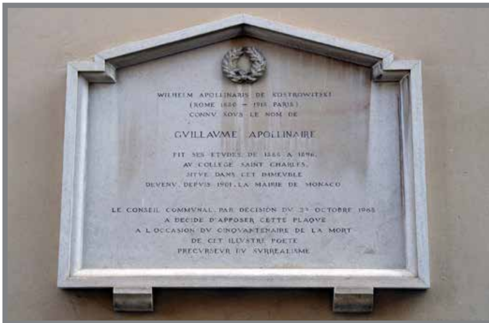
■ Plaque apposée sur la façade de la Mairie de Monaco qui abritait autrefois le Collège Saint Charles