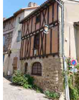
Mairie de la Cité Libre du Vieux Thouars