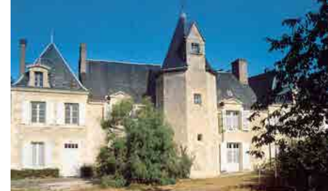
Ancien manoir du Terra

pour découvrir l'église, le lavoir, la maison troglodyte et le pigeonnier !