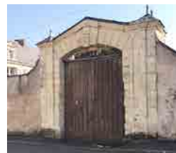
Porche d'entrée de l'ancienne abbaye Saint-Jean-de-Bonneval, rue des Petits Bournaïs

Accès à partir de la rue des Petits Bournaïs.