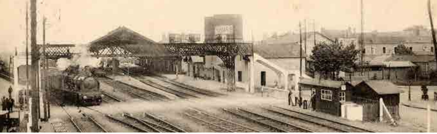
Vue d'ensemble de la gare de Thouars vers 1910