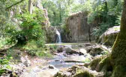
Cascade de Pommiers, vallée du Pressoir