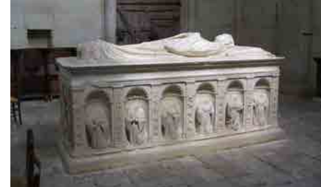
Intérieur de la Collégiale Saint-Maurice d'Oiron