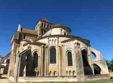
Abbatiale de Saint-Jouin-de-Marnes

secrets de ce site remarquable. Durée : 1 heure. Entrée Gratuite. Passe sanitaire demandé.