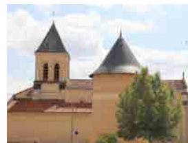
Vue du clocher de l'église et du pigeonnier de Louzy

Visites exceptionnelles de cette église fermée depuis son incendie, par M. L'Abbé Métais. Les visiteurs pourront ensuite se rendre à la salle ( située place de l'église ) où une présentation du chantier de restauration de l'église, lancé prochainement, sera proposée.