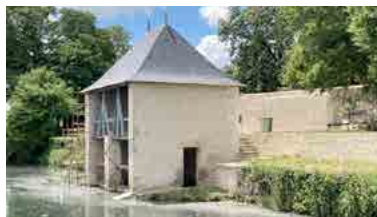
Lavoir-séchoir du Clos de l'Abbaye de Saint-Jean-de-Bonneval

► Eglise Samedi et dimanche 10 h-18h Visite libre du monument.