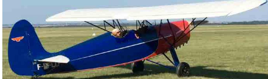
Avion biplace à aile parasol de 1931