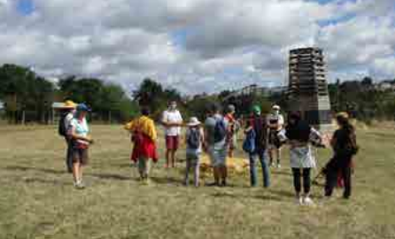
Visite « Souvenir d'une plage »