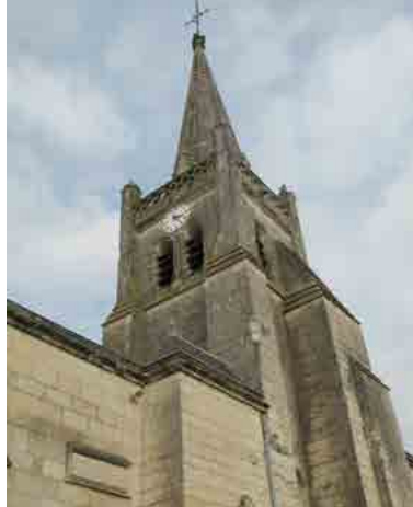
Église de Bouillé-Loretz