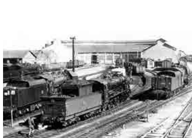
Rotonde du dépôt en 1967