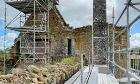
Château de Glénay