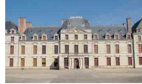
Château des Ducs de la Trémoille

Ce programme peut être modifié en fonction du contexte sanitaire.