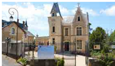
Musée Henri Barré