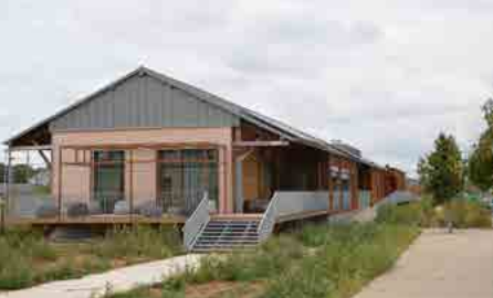
Station T, ancienne gare des marchandises