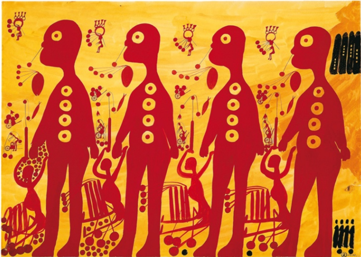
Œuvre de Carlo, 1961, gouache sur papier, 50 x 70 cm