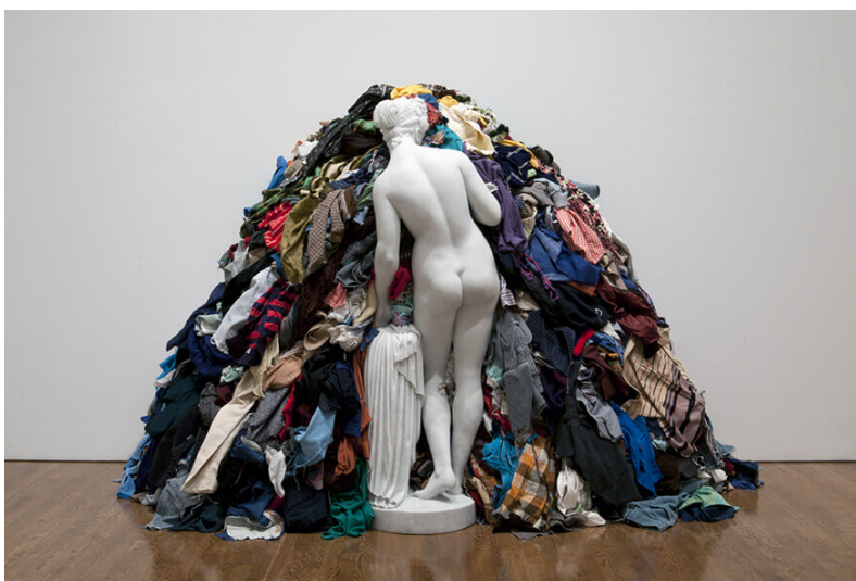
Œuvre de Michelangelo Pistoletto, Vénus aux chiffons (1967) Attribution au Centre Pompidou