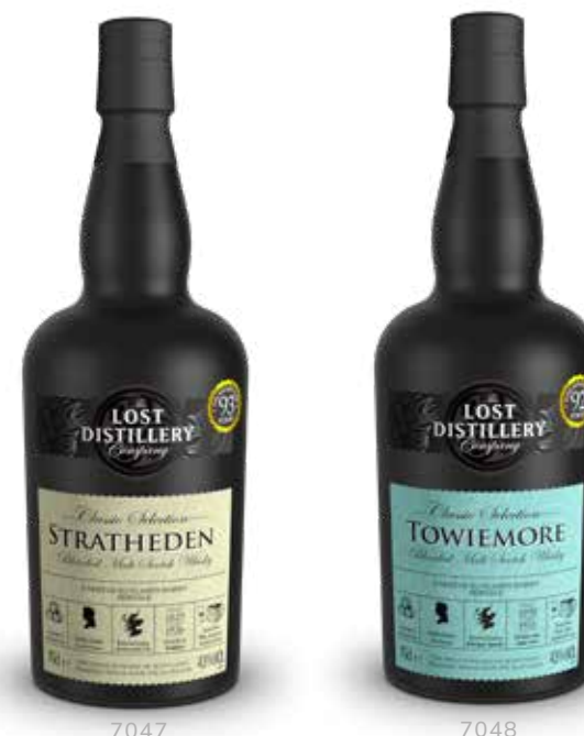
COLLECTION THE LOST DISTILLERY CLASSIC (43° - 70 CL)