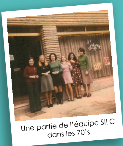
Une partie de l'équipe SILC dans les 70's

C'est le nombre de pays dans lesquels SILC propose des séjours avec cours d'anglais : Afrique du sud, Australie, Canada, USA, Inde, Grande-Bretagne, Irlande, Malte, Nouvelle-Zélande, Singapour.