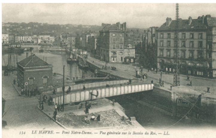
Anonyme, Vue du quai des Casernes , s. d., carte postale, 8,9 x 13,9 cm, Le Havre, musée d'art moderne André Malraux

La toile représente le début du quai Videcoq, à partir du pont Notre-Dame.