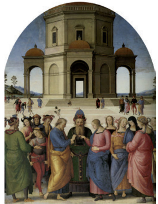
Figure 3. Pietro Vannucci, dit Le Pérugin, Mariage de la Vierge , 1501/4, Caen, musée des b.-a., inv. 171.

Tandis que dans la version du Mariage de la Vierge que l’on peut voir à Caen, le choix du peintre devient un curieux manifeste platonicien mettant en évidence un objet idéal ; quelque chose comme un corps semi-régulier, à l’image, ici complexifiée, des cinq Solides réguliers de Platon – cube, octaèdre, dodécaèdre et icosaèdre, symboles des éléments dans une conception physique néo-aristotélicienne de l’univers – puis des polyèdres réguliers étoilés d’Archimède qui feront les délices des dessinateurs et graveurs du XVI e siècle (Daniele Barbaro ou Wenzel Jamnitzer, pour ne citer qu’eux). Ce choix est dans le droit fil des représentations en perspective des solides platoniciens proposées par Piero della Francesca, par Paolo Uccello, puis par Léonard de Vinci ; ce dernier en donnera des versions “évidées” ( vacua ) aux seules arêtes matérialisées comme un réseau de bois qu’il dessinera pour Luca Pacioli et sa Divina Proportione en partie reprise de l’un des traités de Piero : ainsi ces solides apparaissent-ils comme traversés par la lumière (fig. 4). Notons que la “religion” du Pérugin sur ce point a varié, puisque dans un précédent Mariage... , il avait opté pour la fermeture et le placement de la scène sous le porche lui-même : il s’agit d’un épisode de la prédelle de la Pala di Fano , peinte en 1497, après la Remise... et avant le Mariage... , et que l’on peut voir dans la Chiesa di Santa Maria Nuova (l’église de Fano).