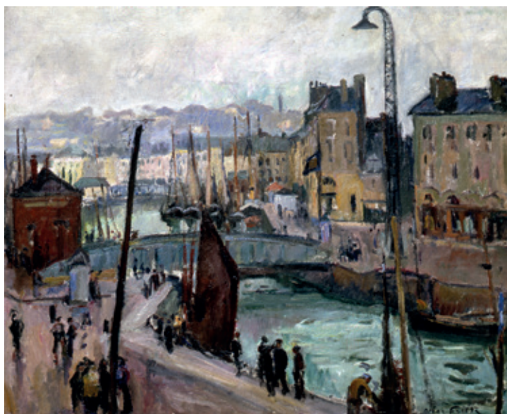
Émile Othon Friesz, Le Havre, bassin du Roy , fin 1905 - début 1906, huile sur toile, 61 x 74 cm Le Havre, musée d'art moderne André Malraux (Inv : 77.39) © MuMa Le Havre © ADAGP, Paris

Dans l'œuvre peint de Dufy on trouve des sujets identiques à la même époque. Le port du Havre au crépuscule ou Effet du soir. Quai de Videcoq au Havre , une huile sur toile datée de 1902 et conservée au musée Calvet à Avignon (Fig. 5) représente le même endroit, à quelques immeubles près, puisqu'on se trouve à l'angle du quai et de la rue des drapiers avec un effet de nuit similaire mais traité dans des tonalités brunes. On peut aussi rapprocher de cette œuvre Le Port du Havre 11 , une gouache sur papier datée de 1898, déposée par le Musée National d'Art Moderne (MNAM) au MuMa ainsi que les aquarelles réalisées sans doute à la même époque, offertes par Dufy lui-même en 1900 au Musée des Beaux-Arts de la ville, Le Quai de l'Île 12 et Le Havre, les docks 13 .