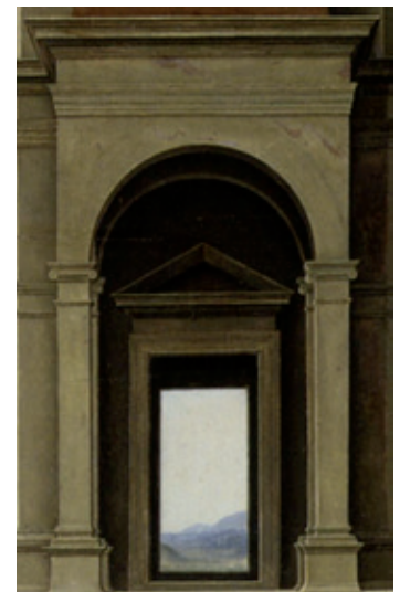
Figure 4. Mariage... Détail des portes ouvertes du temple, en enfilade, déterminant la taille et la profondeur du temple, donc sa très probable forme autocentrée dans le dessin du peintre, cadrant la campagne arrière et surcadrant le point de fuite central.