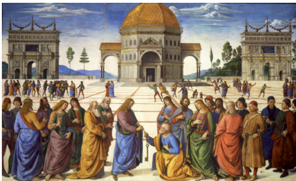
Figure 1. Pietro Vannucci, dit Le Pérugin, Remise des Clefs à saint Pierre , ca. 1482, Vatican, chapelle Sixtine.

qui ont connu de visù l'événement se souviennent de l'extraordinaire intérêt du public qu'avaient suscité ces travaux et cette attention touchant à l'une des œuvres emblématiques du musée : tant auprès des professeurs d'arts plastiques et des très nombreux élèves qui avaient travaillé autour de ce tableau, qu'auprès du public et particulièrement des parents qui s'étaient rendus, certains pour la première fois, au musée ou dans les autres lieux investis pour l'occasion (Hôtel d'Escoville, Bibliothèque municipale et divers établissements scolaires) afin de voir, et l'œuvre de Pérugin, et pour d'autres le labeur de leur progéniture.