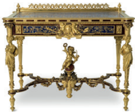
Fig. 6. Christofle et Cie, Emile Reiber, Albert-Ernest Carrier-Belleuse, Gustave-Joseph Chéret, Table de boudoir, 1867, bronze, argent, vermeil, acajou, lapis-lazuli, jaspe rouge du Mont-Blanc, Paris, Musée des Arts décoratifs, Inv. 33777.