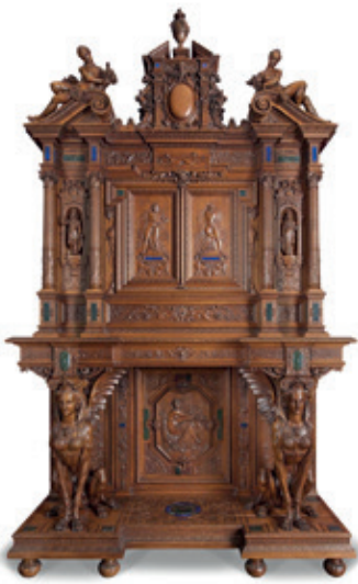
Fig. 4. Henri-Auguste Fourdinois, Cabinet à deux corps, 1867, bâti en chêne, noyer sculpté, incrustation de jaspe sanguin et de lapis-lazuli, intérieur incrusté d'ivoire et d'argent, Paris, Musée des Arts décoratifs, Inv. 29921.