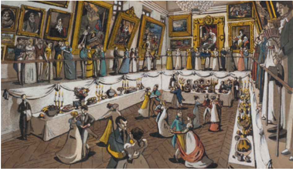
Sarah Fouquet, Dîner donné dans le musée en l'honneur de la duchesse d'Angoulême, dauphine de France, le 9 septembre 1827 . Petite entorse à la réalité historique, le bal qui suivit le dîner se tint, en cette occasion, dans les salons de l'hôtel voisin de la Préfecture.