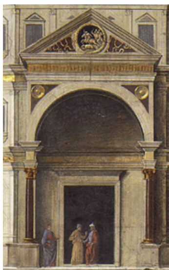
Figure 2. Remise des Clefs... Détail de la porte fermée du temple.

Le Mariage... est un tableau d'autel, peint sur bois. Il rappelle subliminalement au visiteur que le Pérugin fut l'un des premiers à participer au programme iconographique de la Chapelle Sixtine : en effet, Pietro Vannucci est au Vatican dès 1478, travaillant à la décoration de l'antique basilique de Constantin; puis il est mis à contribution par Sixte IV, vers 1480, pour réaliser des fresques dans la nouvelle chapelle, avant que Michelange ne soit invité à reprendre le chantier pour couvrir à fresque le plafond et l'un des murs pignons. Certaines fresques ont alors disparu, mais il en subsiste trois, situées dans le registre médian, qui témoignent du passage du Pérugin – et de membres de son atelier, dont Pinturicchio – : La Remise des Clefs à saint Pierre , Le Baptême du Christ et le Voyage de Moïse , achevées vers 1482 : c'était donc un peintre très célèbre en son temps, une étoile de la Renaissance italienne en somme, qui a peut-être pâli de cette proximité avec tant d'autres noms et lieux prestigieux de son firmament personnel.