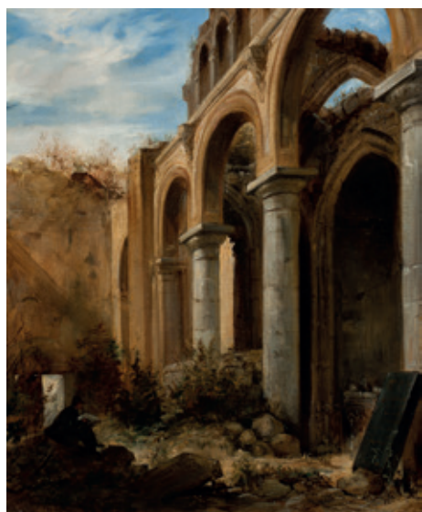
Eugène Delacroix : Les ruines de la chapelle de l'Abbaye de Valmont , inv. 2012