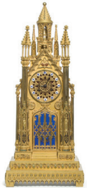
Fig. 2. Anonyme, Pendule, vers 1855, cuivre doré et émaillé, Paris, Musée des Arts décoratifs, Inv. 41999.