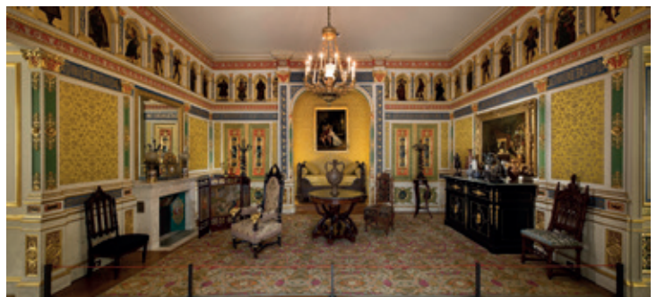
Fig. 3. Chambre à coucher du baron Hope, 1840.