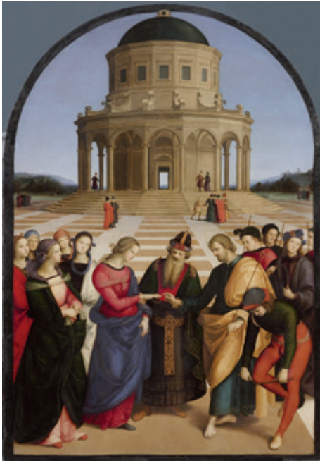
Figure 5. Raphaël (Raffaello Sanzio, 1483-1520), Sposalizio (ca. 1504), Milan, Pinacothèque de la Brera.