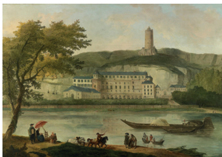
Hubert Robert : Le Château de la Roche Guyon , inv.1909, © C. Lancien, C. Loisel, RMR Normandie

Le paysage se transforme également, devient un miroir qui révèle moins la nature que l'état d'esprit de l'artiste. Turner entremêle les volutes humides et les vagues pour donner à voir les éléments déchainés. L'angoisse étirent le cœur devant ses rafales de vent aux tons fondus. A force d'empâtements, les tourbillons soulevés par Turner au