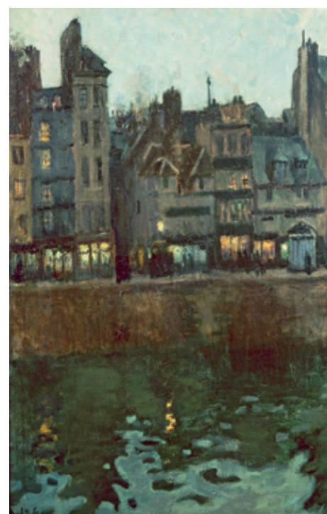
Raoul Dufy, Le Port du Havre au crépuscule ou Effet du soir. Quai Videcoq au Havre , 1902, huile sur toile, 73 x 60 cm. Avignon, musée Calvet, Legs Joseph Rignault