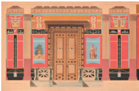
Fig. 5. Alfred Normand, Vestibule - coupe sur la largeur au 1/10e de la maison pompéienne, 1862, graphite, plume, encre noire, lavis gris, aquarelle et gouache sur papier, Paris, Musée des Arts décoratifs, Inv. 45383.