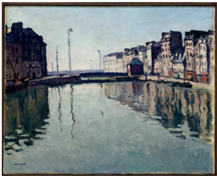
Albert Marquet, Le Bassin du Roy au Havre , vers 1906, huile sur toile, 65 x 80,5 cm. Paris, Musée National d'Art Moderne, déposé à Caen, musée des Beaux-Arts © Centre Pompidou - MNAM-CCI, Dist. RMN-Grand Palais/Jean-Claude Planchet © ADAGP, Paris

Raoul Dufy avait également choisi de représenter le Havre pour sa première présentation au Salon en 1901. Dans son tableau intitulé Fin de journée au Havre 14 , comme Friesz, c'est l'ambiance particulière, sombre et pittoresque de la vie populaire et portuaire de sa ville natale qui l'avait inspirée.