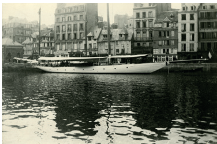
Anonyme, Le Bassin du Roy , 1905, tirage photographie argentique noir et blanc sur papier, 22,1 x 14,7 cm, Le Havre, Archives Municipales 7Fi142, © Archives Municipales du Havre

Beaux-Arts de la ville dès 1892 où il reçoit l'enseignement du peintre Charles Lhullier. Il y rencontre en 1894 Raoul Dufy. En 1897 il obtient une bourse de 1200 francs par an attribuée par la ville du Havre et par le département de la Seine-Inférieure pour étudier à Paris. En 1899, il devient l'élève de Léon Bonnat à l'école nationale des Beaux-Arts. Avec Dufy, il y fait la connaissance de Matisse, Rouault et Camoin, élèves de l'atelier de Gustave Moreau, voisin du leur.