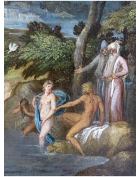
Figure 9. Lambert Sustris (ca. 1510/20-ca. 1584), Baptême du Christ (fin des années 1540), Autriche, coll. Vok.