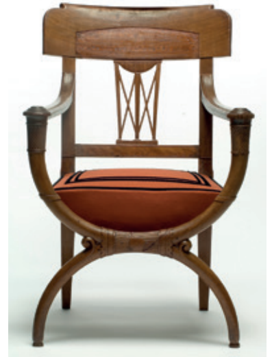
Fig. 1. Attribué à Jacob frères, Fauteuil curule, 1796-1803, hêtre et acajou sculpté, Paris, Musée des Arts décoratifs, Inv. MOB NAT GME 5257.