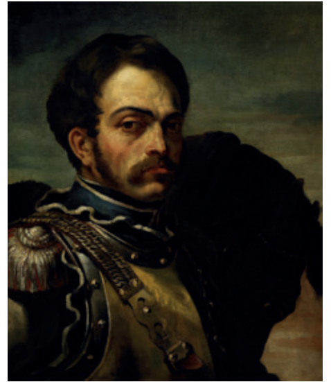
Théodore Géricault : Officier des Chasseurs , inv. 1908, © C. Lancien, C. Loisel, RMR Normandie