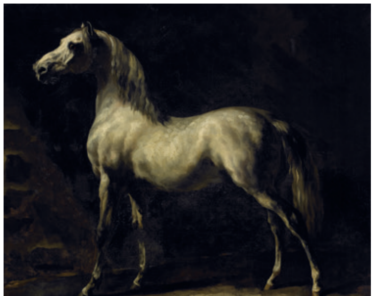
Théodore Géricault : Cheval gris, cheval Blanc , inv. 1850, © C. Lancien, C. Loisel, RMR Normandie