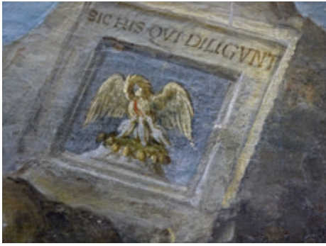
Figure 7. Détail de la pierre gravée au pélican.

Baptême... du Pérugin à la Sixtine (ca. 1482), pour ne prendre que cet exemple en Italie, ou, par exemple encore, dans le Baptême... peint dans les années 1510 en Europe du Nord par Joachim Patinir (ca. 1483-1524) ; Sustris semble leur avoir emboîté le pas, de ce point de vue, dès la fin des années 1540, lorsqu'il a peint un premier Baptême... (Collection Vok, Autriche) après avoir représenté la Prédication de Jean le Baptiste , au milieu des années 1530 (Utrecht, Centraal Museum), thème sur lequel il revient au début des années 1540 (Venise, Antichità Pietro Scarpa) : dans tous ces tableaux, la "foule" est "déjà" là. Mais si l'on excepte quelques œuvres, dont celles citées à l'instant, la tendance est à la verticalité, en Italie, en particulier, dans un format qui permet d'isoler le couple Jésus-Jean, et de représenter à la fois le geste du Baptiste au-dessus de la tête du baptisé, ainsi que la colombe et le plus souvent, le Père qui est aux cieux.