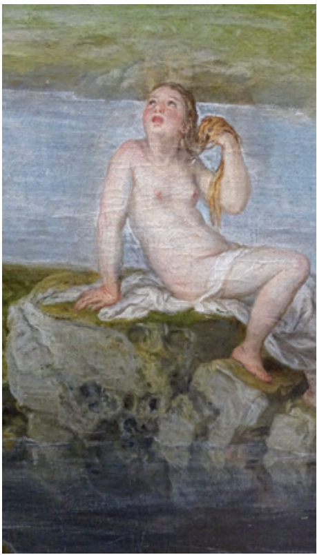
Figure 8. Baptême... Détail de la femme sur le rocher.

Pour autant, la composition du tableau de Caen dans le registre du paysage, innove au regard des traditions italienne et flamande, ici croisées, au point d'avoir, nous semble-t-il, quelque postérité. Certes, l'art de disposer une rivière sinueuse dans un large paysage, d'un amont dans les lointains vers un aval qui semble enclore le spectateur avant de poursuivre, a été le fait des primitifs flamands, par exemple, mais il trouve ici un sens singulier : le baptême du Christ devient symbole d'une humanité partageable avec la foule de ceux qui rejoindront les rangs de l'église universelle, même si l'on entend bien que ce manifeste se situe dans le domaine d'un humanisme chrétien partisan et redoutant les Réformes montantes : la référence explicite à la commandite en fait foi ; le symbole christique du pélican (fig. 7), se trouvant sur un morceau de ruine gisant dans l'eau, au coin droit du tableau, est en effet l'emblème du cardinal d'Augsburg, grand acteur de la Réforme catholique (expression qui s'est imposée de nos jours pour se substituer à celui de Contre-Réforme, adopté au XIX e siècle) et du Concile de Trente où il apparaîtra assez isolé comme envoyé de contrées où des catholiques résistent encore à une Réforme protestante dominante.