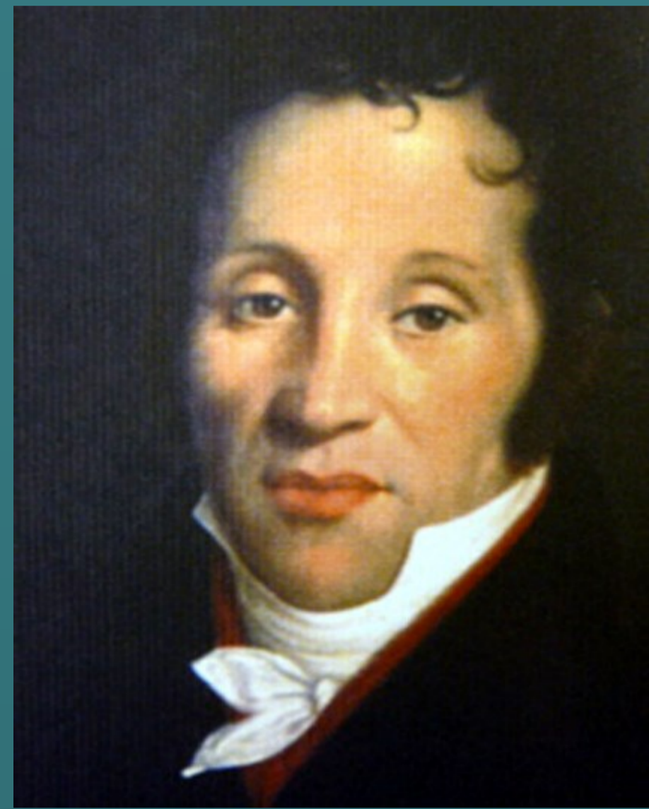
Manuel del Populo Vicente Rodriguez dit Garcia Né à Séville le 22 janvier 1775 - Décédé à Paris le 9 juin 1832

Parmi les familles qui ont touchés à tous les domaines de la musique, il en est une qui a ratisé particulièrement large en côtoyant, pendant trois générations, les meilleurs artistes de son époque.