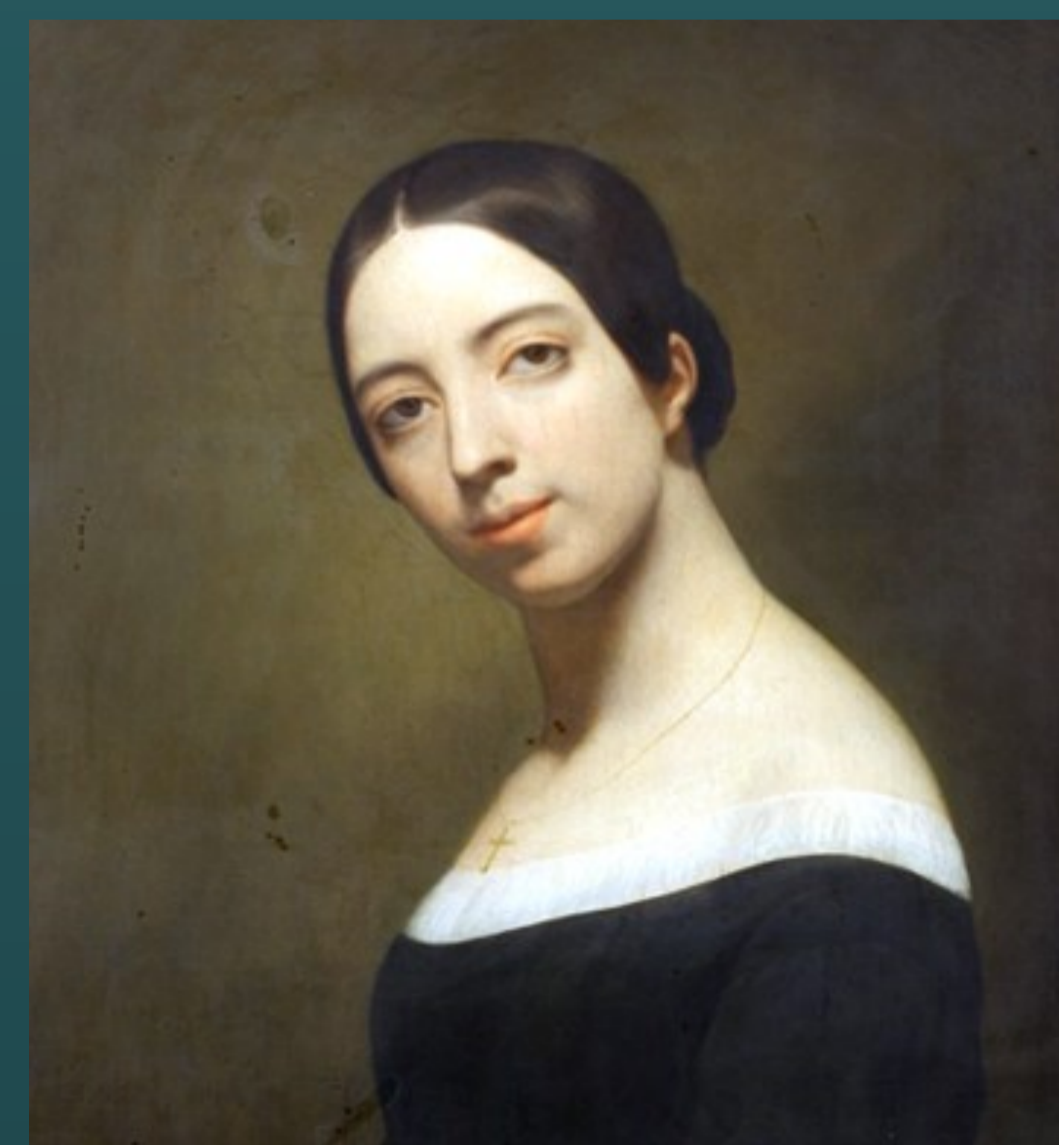
Pauline Viardot-Garcia Née à Paris le 18 juillet 1821 - Décédée le 18 mai 1910 à Paris.