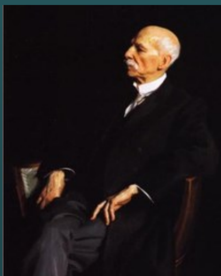
Patricio Manuel Garcia Né à Madrid le 17 mars 1805 - Décédé le 1er juillet 1906 à Londres.

Il est mort après une brève maladie et fut enterré dans le cimetière du Père Lachaise en bordure de la 25ème division.