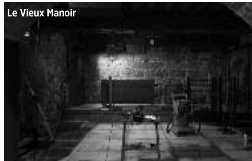
Le Vieux Manoir