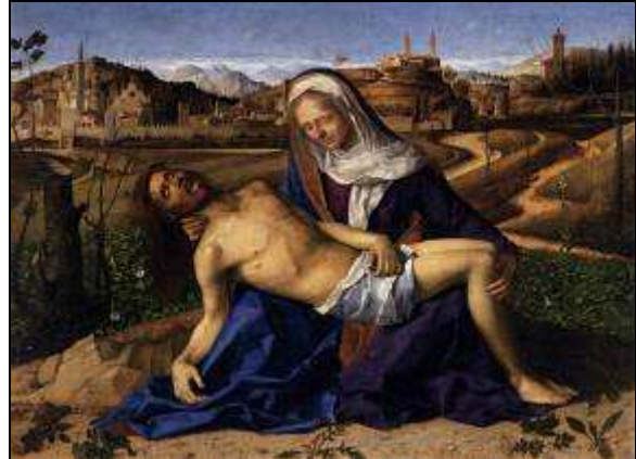
Piéta Giovanni BELLINI 15 e /16 e