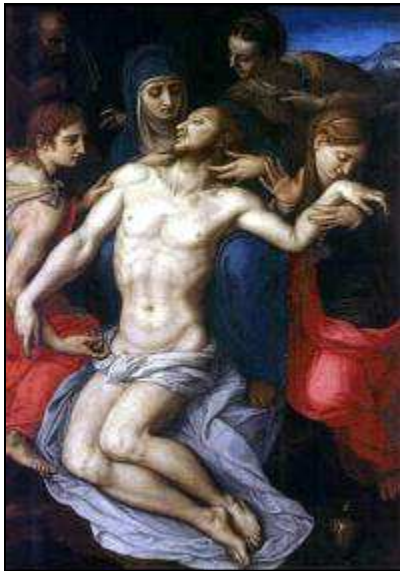
Agnolo BRONZINO Piéta 16 e