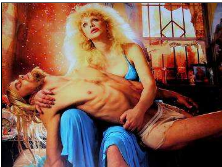
David LACHAPELLE (Photographie)