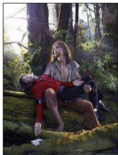
David LACHAPELLE (Photographie)