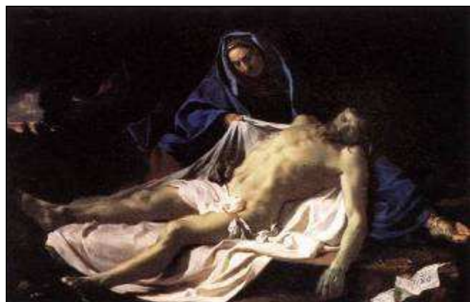
Charles LEBRUN 17 e