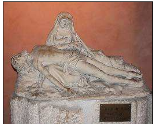
Piéta de Montluçon 15 e