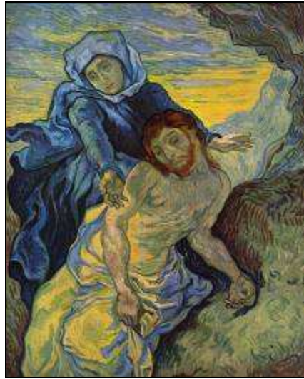
Vincent VAN GOGH