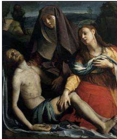
Agnolo BRONZINO Piéta avec Marie Madeleine 16 e