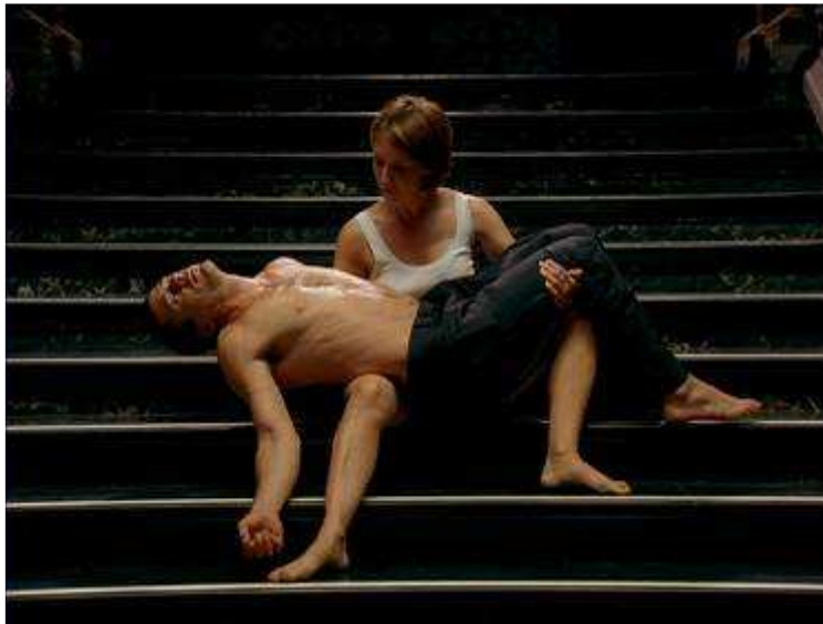
Sam TAYLOR WOOD (Vidéo)