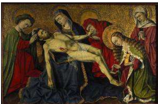
Piéta de Tarascon 15 e