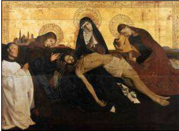
Pietà d'Avignon Enguerrand QUARTON 16 e