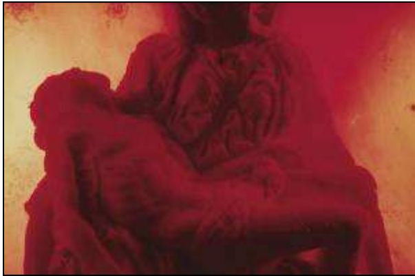
Andrés SERRANO (Photographie)