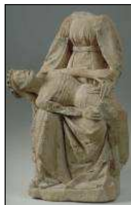
Piéta Moyen âge