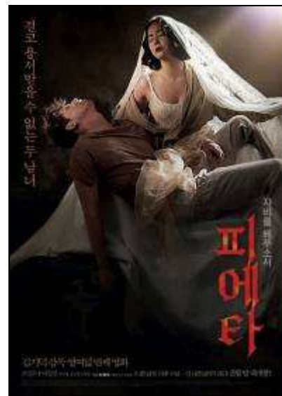
Kim Ki-duk Piéta (Cinéma) Lion d'or Mostra Venise