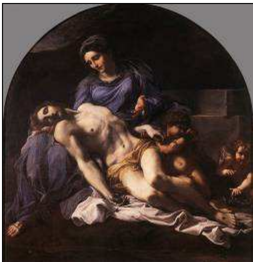
Annibale CARRACI Piéta 1600