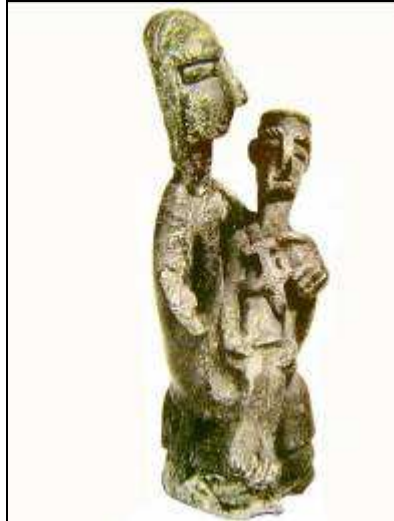
Mère de la victime Bronze (-VIIIe / -Ve) Musée Archéologique National Cagliari