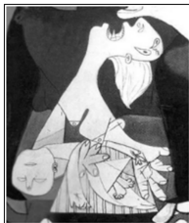
Pablo PICASSO Guernica (fragment)