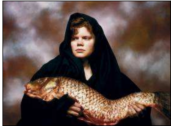
Andrés SERRANO (Photographie)