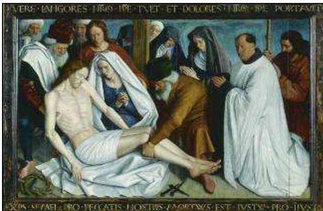
Piéta Jean FOUQUET 15 e