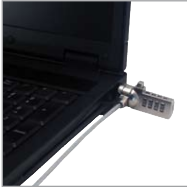
• Ordinateur portable

STANDARD LOCK SYSTEM FOR NOTEBOOK - ANTIRROBO STANDARD PARA NOTEBOOK CABLE DE ACERO