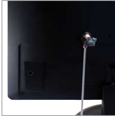
• Ecran plat