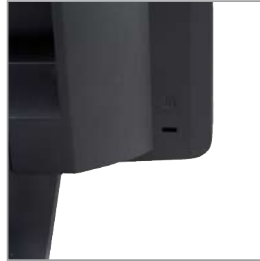
• Matériel équipé d'une encoche type «Kensington»