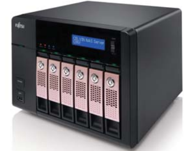
CELVIN NAS Server Q902 6x2TB NAS HDD