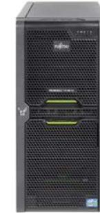
PRIMERGY TX140 S2