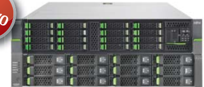
ETERNUS CS800 S5

ETCS8-ENTRY-P50 x 1 + ETCS8-S15 x 1 + ETCS8-EN5-SUBSCR1Y x 3 + U10443-C807 x 1