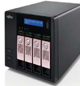
CELVIN NAS Server Q802 4x1TB NAS HDD