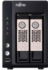
CELVIN NAS Server Q703 2x2TB NAS