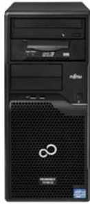
PRIMERGY TX100 S3p