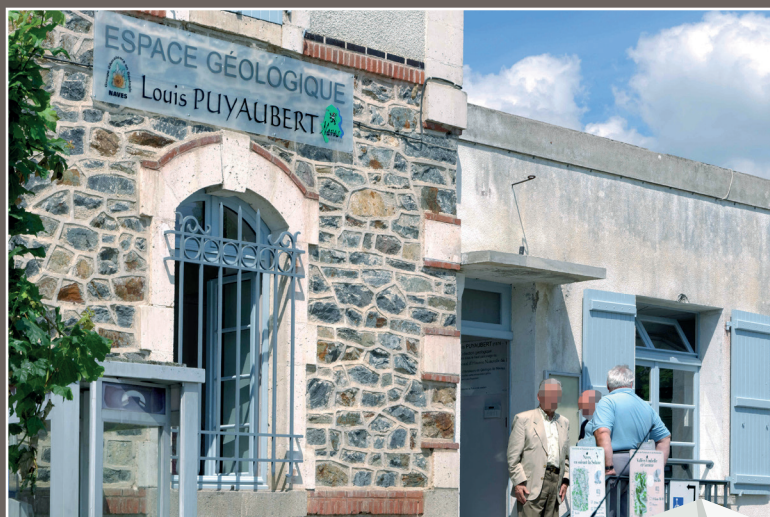
L'entrée de l'espace Louis Puyaubert