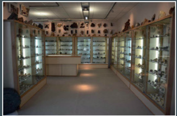
L'entrée intérieure

Le catalogue original manuscrit (inventaire de la collection), le microscope du Dr Puyaubert et quelques éléments de correspondance permettent d'illustrer l'importance des échanges opérés entre le chercheur local et les scientifiques de son époque.