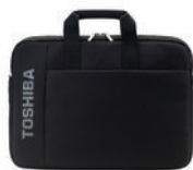
Notebooktasche B114 (PX1877E-1NCA)