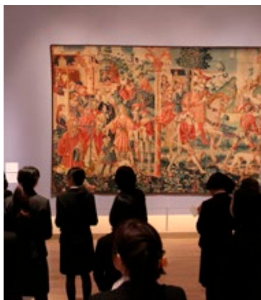
National Art Center de Tokyo 24 avril 2013