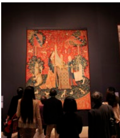
National Art Center de Tokyo 24 avril 2013

Ces deux expositions au Japon ont été couronnées de succès, et ont totalisé pas moins de 331 789 visiteurs sur les six mois d'ouverture .