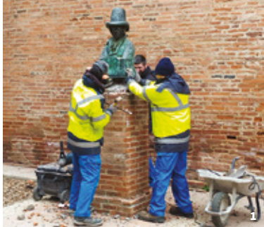
1. Dépose du buste de Jeanbon Saint-André