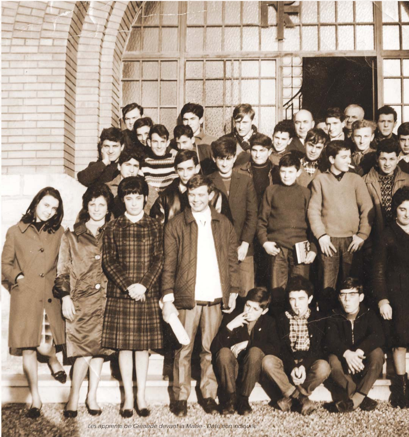
Les apprentis de Grenade devant la Mairie - Date non indiquée