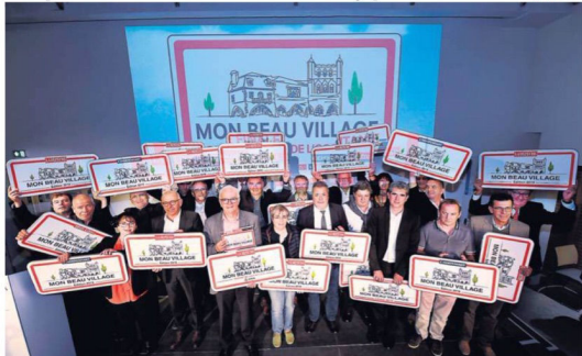
Les lauréats de l'édition 2019 de « Mon beau village », hier à Toulouse.

OCCITANIE. Les prix du concours « Mon beau village » organisé par le Groupe La Dépêche ont été remis hier soir. Bozouls est le village préféré de nos lecteurs. > pages 2-3