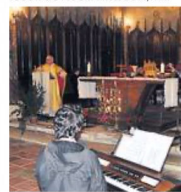
Harmonie lupiacoise / Photo DDM.

Une homélie à la Don Camillo le soir de Noël. / Photo DDM, F. M.