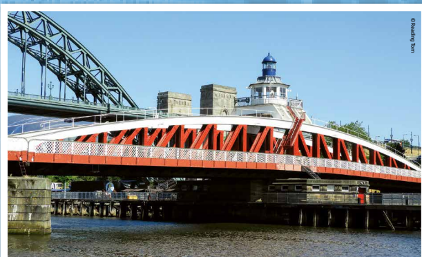
Le pont tournant de Newcastle suite aux réparations