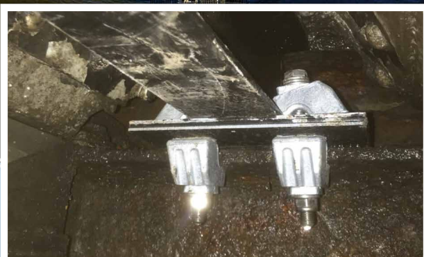
Crapauds de fixation Type AAF utilisés pour assembler les poutres de renforcement

Une récente inspection ayant révélé de la corrosion sur les extrémités des gouttières en aluminium, il était nécessaire d'installer des renforcements sur le pont.