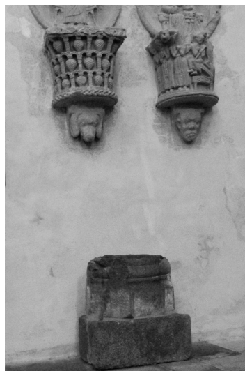
Clé de voûte dans l'église.

Suivant les volontés de la dernière propriétaire, la pierre a été restituée à l'église en 2021 et installée sous l'ensemble de pierres sculptées conservé sur le mur méridional de la première travée de la nef.