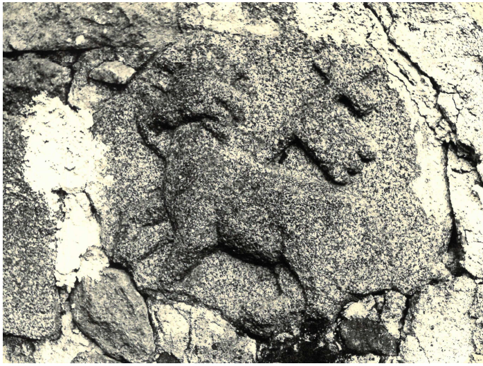
Agneau dans le mur en 1975