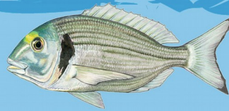
Dorade royale ( Sparus aurata ) Taille minimale : 30 cm Quota : 5 individus