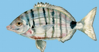
Sar à museau pointu ( Diplodus puntazzo ) Taille minimale : 25 cm Quota : 10 individus