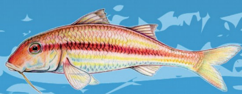
Rouget barbet de roche ( Mullus surmuletus ) Taille minimale: 18 cm Quota : 10 individus