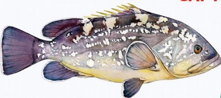
Mérou brun ( Epinephelus marginatus ) Espèce protégée