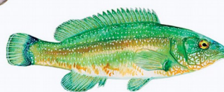
Labre vert ( Labrus viridis ) Espèce vulnérable