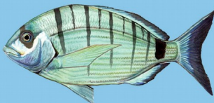
Sar commun ( Diplodus sargus ) Taille minimale : 25 cm Quota : 10 individus