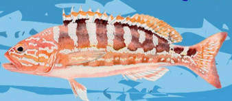
Serran chevrette ( Serranus cabrilla ) Taille minimale : 15 cm Quota : 20 individus