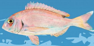
Pagre ( Pagrus pagrus ) Taille minimale : 25 cm Quota : 5 individus

Un maximum de 10 individus par jour et par pêcheur à pied ou par jour et par navire ne pourra être dépassé (hors serrans et oblades)