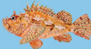
Chapon ( Scorpaena scrofa ) Taille minimale : 35 cm Quota : 3 individus