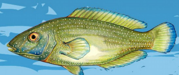
Labre merle ( Labrus merula ) Taille minimale : 22 cm Quota : 3 individus