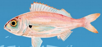
Galet ( Pagellus acarne ) Taille minimale : 20 cm Quota : 10 individus