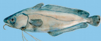
Mostelle ( Phycis phycis ) Taille minimale: 30 cm Quota : 5 individus