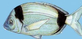
Sar à tête noire ( Diplodus vulgaris ) Taille minimale : 25 cm Quota : 10 individus