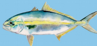
Grande Sériole ( Seriola dumerili ) Taille minimale : 50 cm Quota : 2 individus