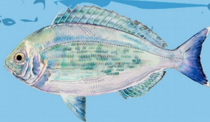
Dorade grise ( Spondyliosoma cantharus ) Taille minimale : 25 cm Quota : 6 individus