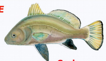
Corb ( Sciaena umbra ) Espèce protégée