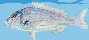
Denti ( Dentex dentex ) Taille minimale : 35 cm Quota : 2 individus