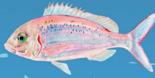
Pageot commun ( Pagellus erythrinus ) Taille minimale : 25 cm Quota : 10 individus