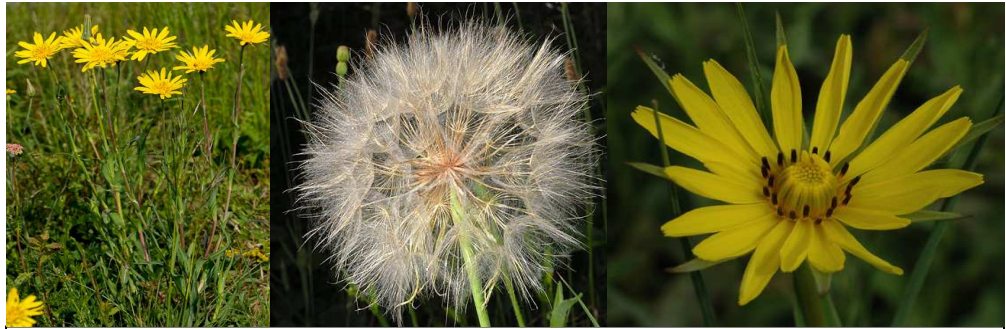
Salsifis des prés