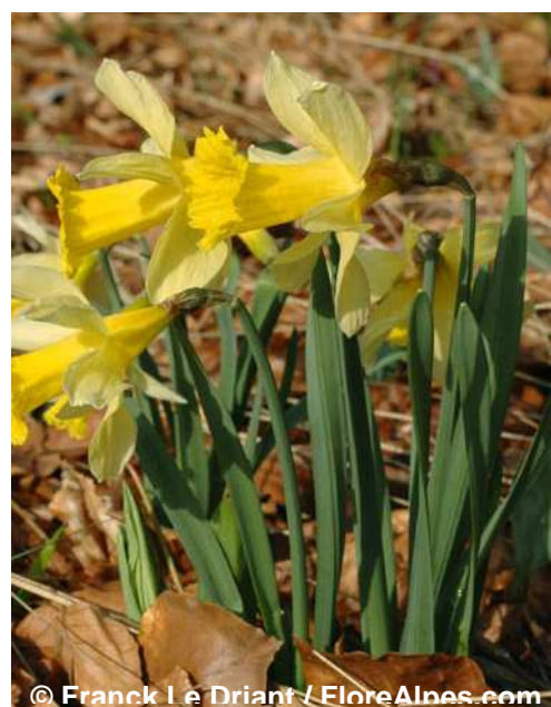
Jonquille des bois Narcissus pseudonarcissus

Floraison : mars à juin / Habitat : prés, sous-bois humides / Hauteur : 15 à 40 cm / Fleur : 40 à 65 mm