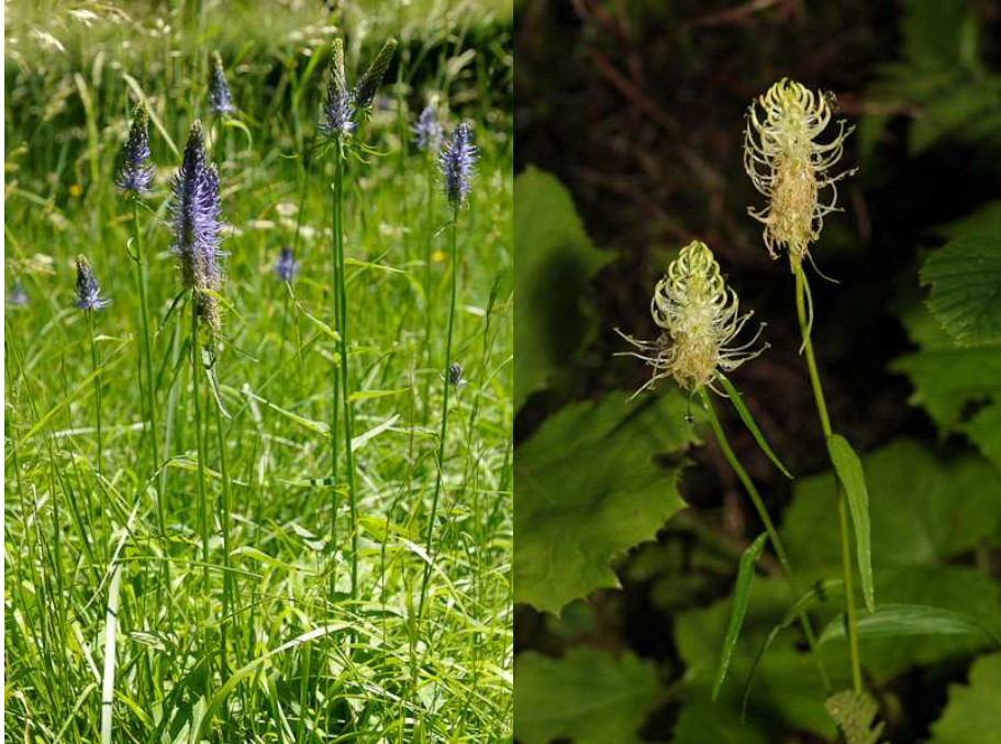
Raiponce en épi Phyteuma spicatum