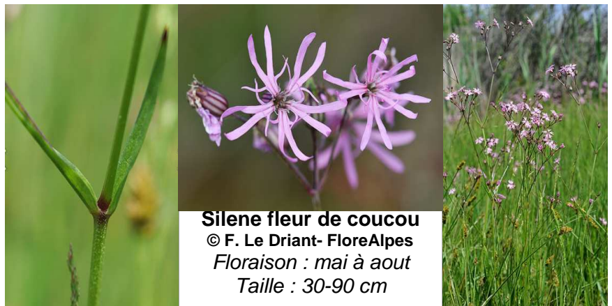
Silène fleur de coucou Floraison : mai à aout Taille : 30-90 cm

Ce silène se reconnaît très facilement à la forme très découpée de ses pétales roses. Sa tige est souvent élevée, permettant aux fleurs d'émerger des prairies humides où pousse cette plante.