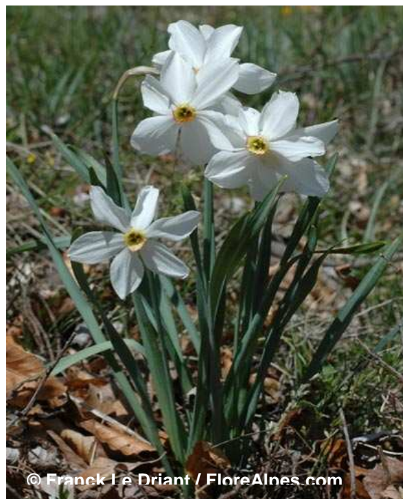
Narcisse des poètes Narcissus poeticus

Floraison : avril à mai / Habitat : prés humides / Hauteur : 20 à 40 cm / Fleur : 35-60 mm