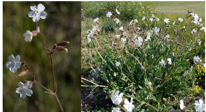
Compagnon blanc Silene latifolia subsp alba © Franck Le Driant / FloreAlpes.com Floraison : mai à juillet / Taille : 30-70 cm

Ce silène est très courant en bord de champs et chemins. L'ensemble de la plante est velu et glanduleux. Ses fleurs sont blanches, aux pétales profondément échancrés, très odorantes. Ses feuilles sont ovales et très velues.