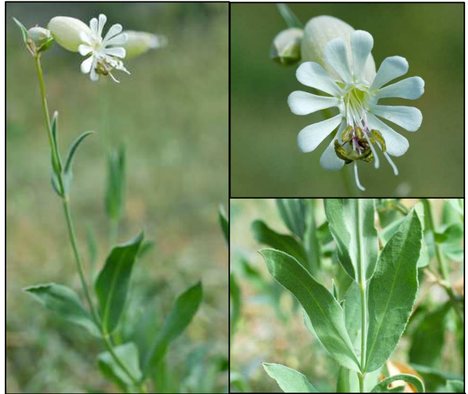
Silène enflé Silene vulgaris Floraison : avril à sept / Taille : 30-70

Ce silène se reconnaît principalement à sa fleur renflée en forme de ballons plus ou moins ronds, sans poils, à vingt nervures, souvent parcourus d'un réseau pourpre. Ses feuilles sont sans poils ou ciliées, allongées et aiguës.