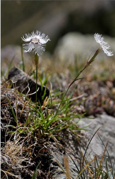
Œillet de Montpellier Dianthus hyssopifolius L.