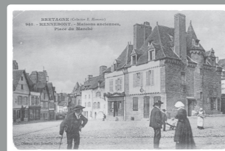
La place du marché vers 1910. Les grandes maisons de droite masquent le puits ferré.

Rive droite, en Vieille-Ville, la façade de l'hôtel Lhermitte (2) porte la date de 1586. C'est là une des plus anciennes de la ville. En Ville-Close, malgré les effets des bombardements, quatre maisons à pans de bois subsistent encore. La plus fameuse est la maison du Sénéchal (1). Elle tire son nom de sa proximité avec l'ancien tribunal. Maison à pans de bois à deux étages en encorbellement, elle date des années 1580. Des chiffres romains gravés sur les pièces de bois indiquent leur assemblage. Sa voisine aux pans de bois cachés sous un enduit date de 1632.