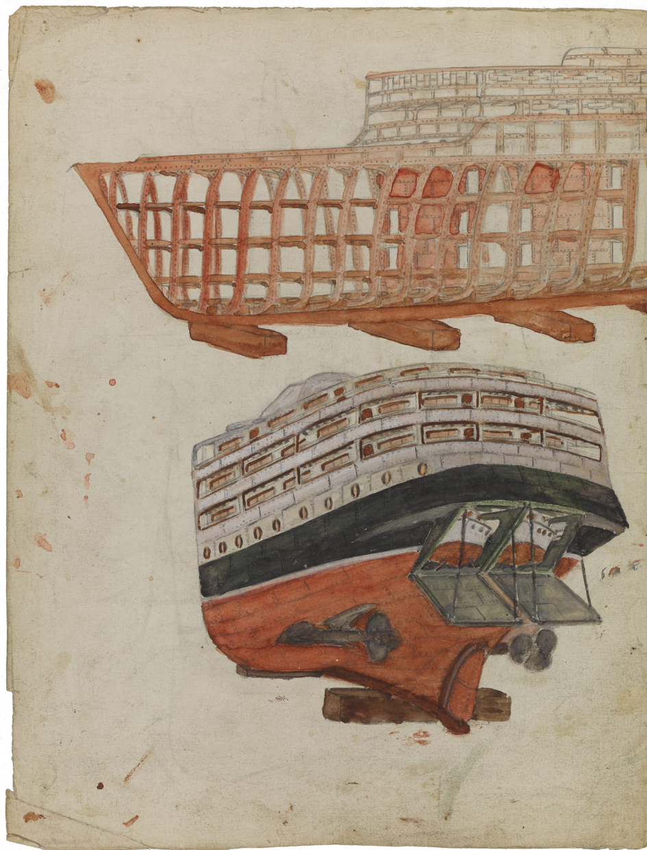
Thomas BOIXO Sans titre non daté aquarelle sur deux pages d'un cahier 33 x 25 cm