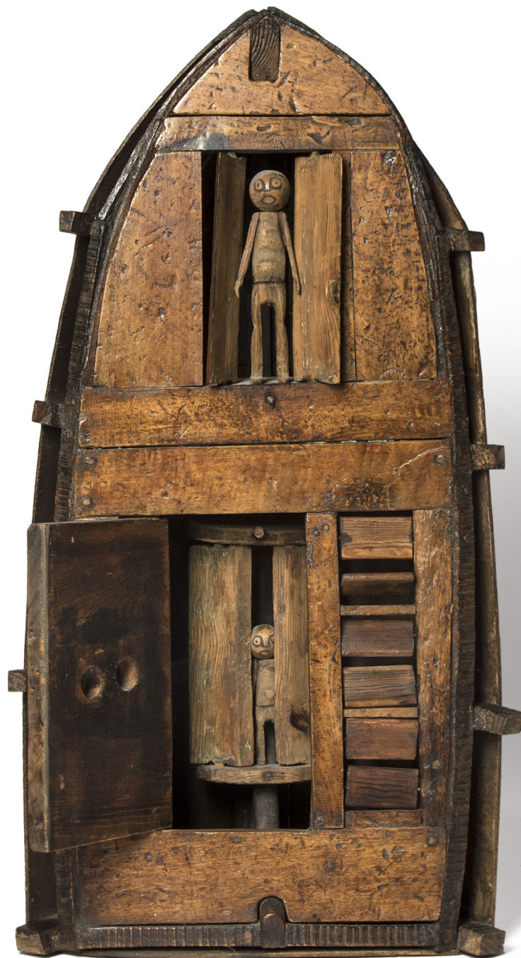
Pascal VERBENA Habitable 1977 bois chevillé 78 x 42 x 32 cm