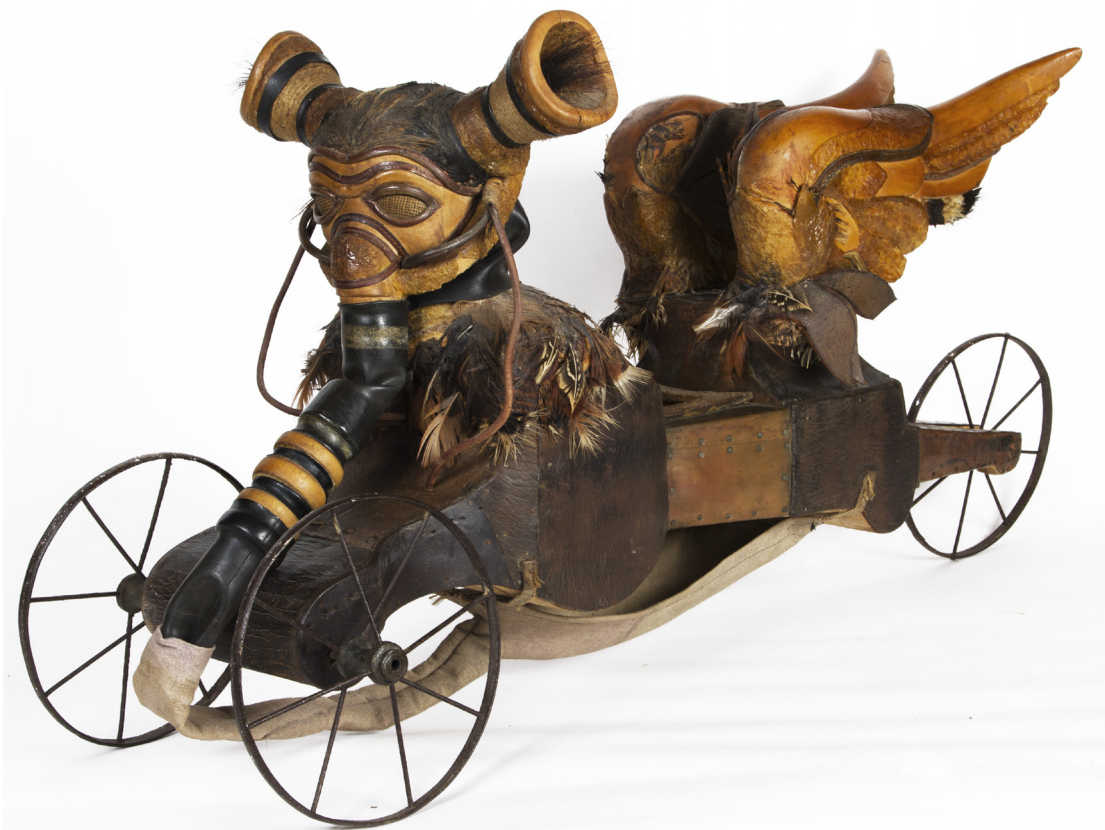
Joël NÉGRI Sans titre non daté