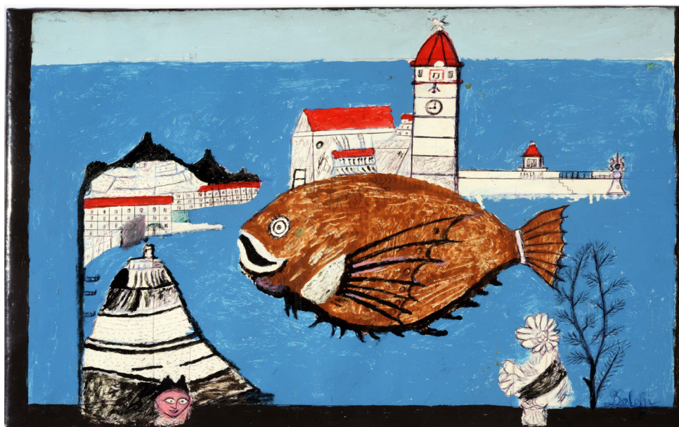
François BALOFFI Port de Collioure non daté peinture acrylique sur sac d'engrais, 33 x 55 x 2 cm