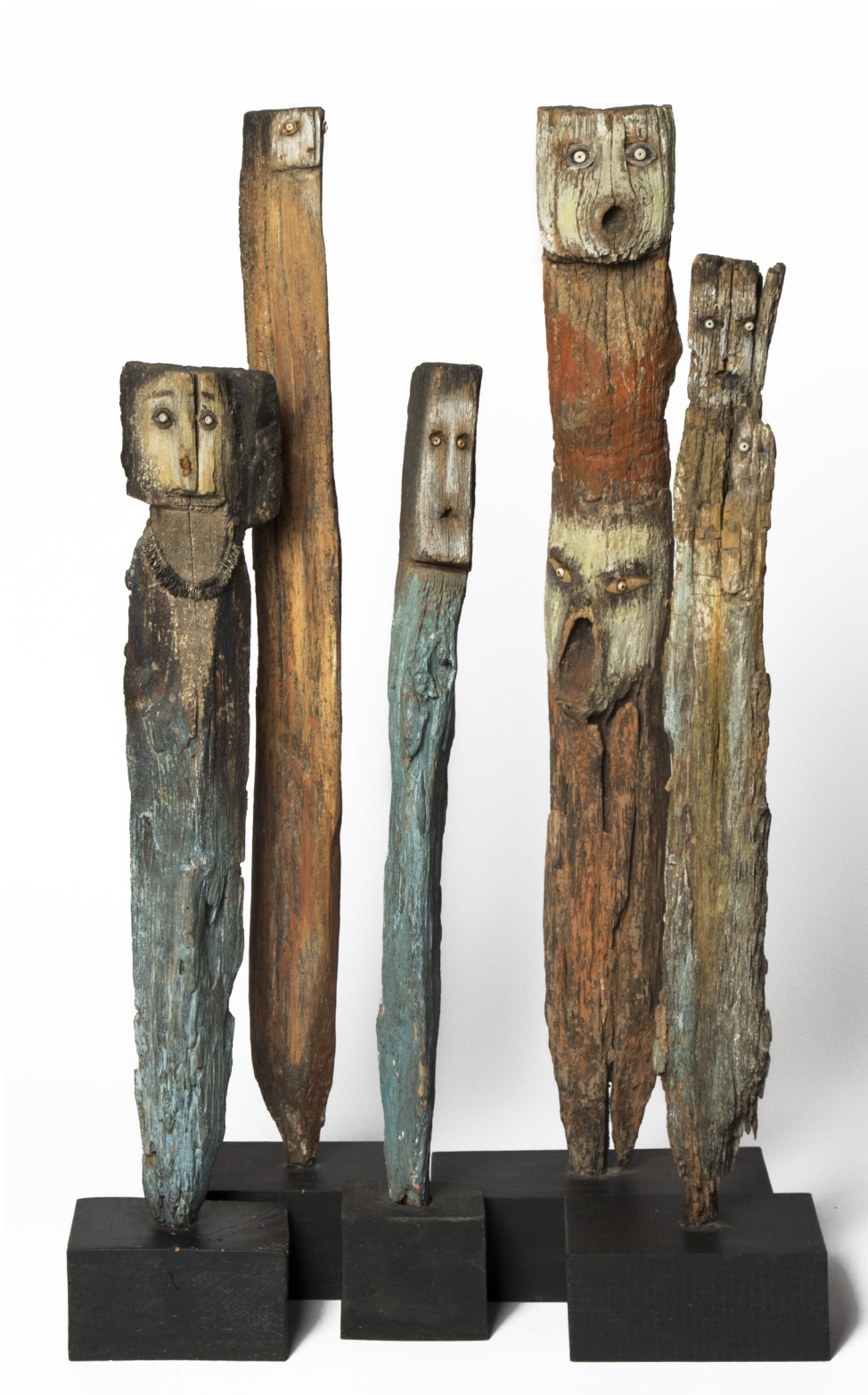
TÔ Bich Hai Groupe de pieuses non daté Piquets de vigne en bois ensemble 73 x 35 x 25 cm