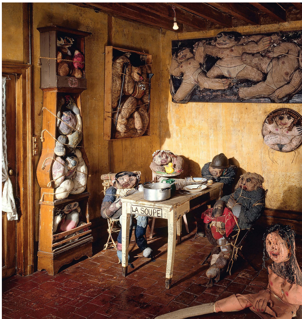
Francis MARSHALL La soupe non daté