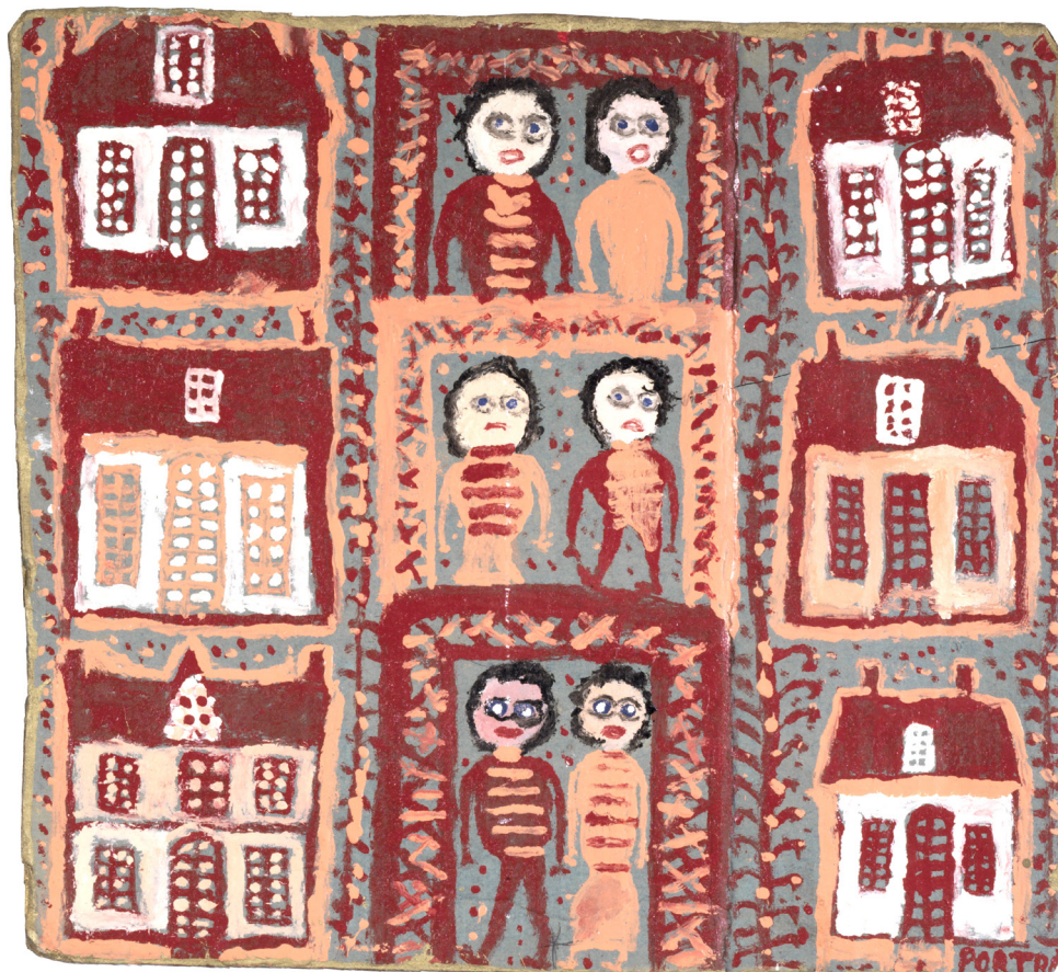
François PORTRAT Sans titre non daté peinture sur carton 35 x 40 cm