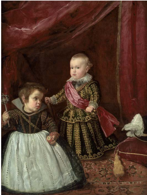
Diego Velázquez, Portrait de l'infant Baltasar Carlos et son nain (vers 1631), huile sur toile, 128 x 102 cm, Boston, Museum of Fine Arts.