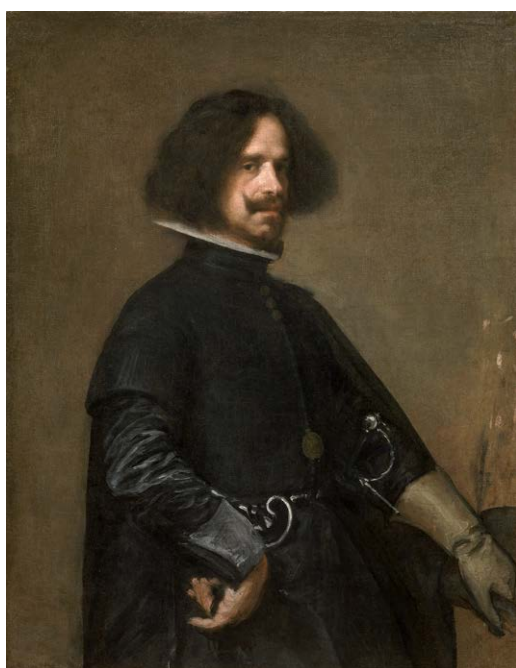
Diego Velázquez, Autoportrait (1644-1652), Florence, Offices

Diego Velázquez est considéré comme le grand maître du Siècle d'or espagnol. Bien que l'on dispose de peu de sources manuscrites le concernant, il est possible de retracer la vie et l'évolution artistique du peintre, qui sont étroitement liées. Qui se cache derrière « le peintre des peintres », selon la célèbre formule de Manet ?