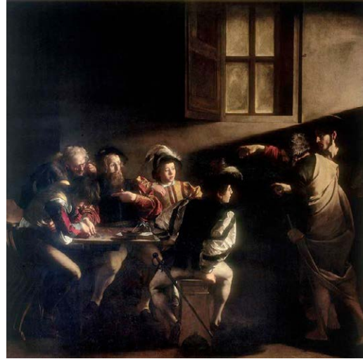
Image de comparaison : Le Caravage, Merisi da Caravaggio Michelangelo dit, La Vocation de saint Matthieu (vers 1571-1610), huile sur toile, 322 x 340 cm, Rome, Eglise Saint-Louis-des-Français.