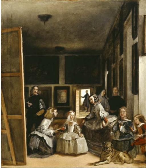
Juan Bautista Martínez del Mazo, La Famille de Philippe IV (copie d'après Les Ménines de Velázquez) (1658-1667), huile sur toile, 140,5 x 124 cm, Swindon (Dorset), The National Trust, Kingston Lacy.