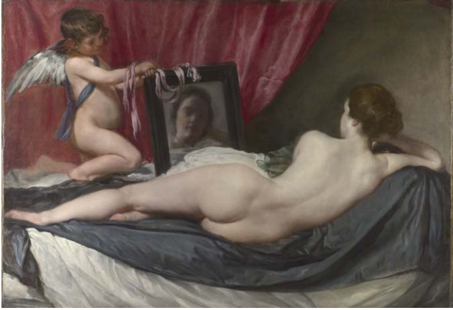
Diego Velázquez, La toilette de Vénus (1647-1651), huile sur toile, 122,5 x 177 cm, Londres, National Gallery.