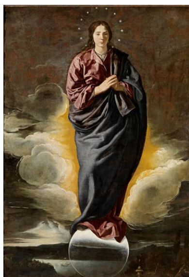
Diego Velázquez, L'Immaculée Conception (1618-1619), huile sur toile, 135 x 101,6 cm, Londres, National Gallery.