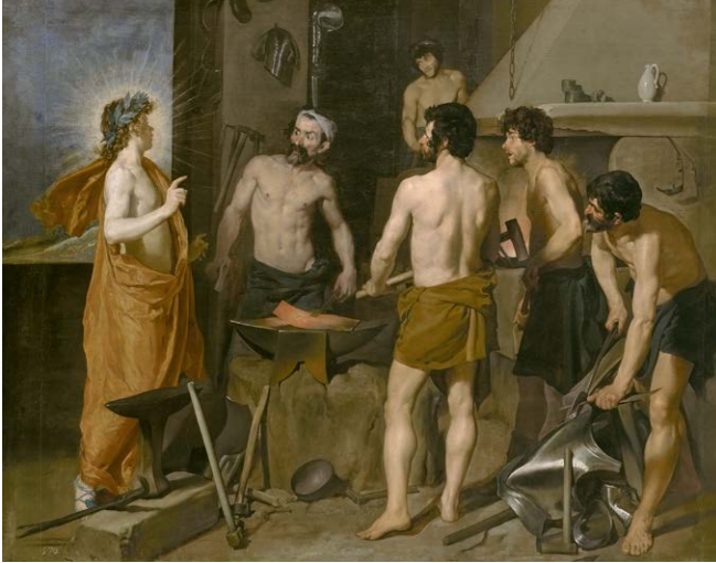
Diego Velázquez, La Forge de Vulcain (1630), huile sur toile, 222x290 cm, Madrid, Museo Nacional del Prado.