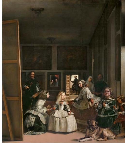
Illustrations de comparaison : Diego Velázquez, Les Ménines ou La Famille de Philippe IV (vers 1656), huile sur toile, 318 x 276 cm, Madrid, Museo Nacional del Prado.