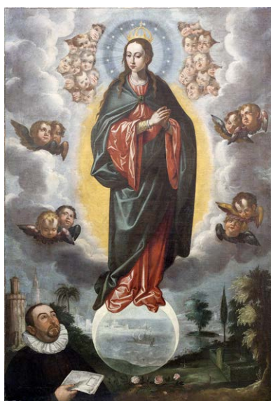
Image de comparaison : Francisco Pacheco, L'Immaculée Conception avec Miguel Cid (1619), huile sur toile, 160 x 109 cm, Séville, Cathédrale.