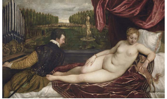
Titien, Vénus et la Musique (vers 1550), huile sur toile, 138 x 222 cm, Madrid, Museo Nacional del Prado.

Cette œuvre est l'unique nu peint par Velázquez et l'un des rares tableaux sur ce thème de la peinture espagnole, avec La Maja desnuda (1795-1800) de Goya. En peignant un tel sujet à Madrid, le peintre risquait la colère de l'Eglise et l'excommunication, même si de tels exemples étaient sous ses yeux dans les collections du roi Philippe IV, qui ne possédait pas moins de quarante tableaux de nus. Plusieurs œuvres du peintre vénitien Titien, dont Vénus et la Musique (1550) et une œuvre de Rubens, Vénus à sa toilette avec un Cupidon de 1628, ont pu inspirer le maître espagnol. Il s'agit bien d'un sujet mythologique même si la composition reste simple et réaliste. Le miroir, la nudité de la jeune femme mais surtout la présence du personnage ailé, permettent d'identifier Vénus, accompagnée de son fils Cupidon. Ce dernier n'a ni flèches, ni carquois, ses attributs habituels, et mis à part le miroir qu'il tient en main, aucun objet symbolique (rose, pomme, perles) n'accompagne la représentation de la déesse de l'amour et de la beauté.