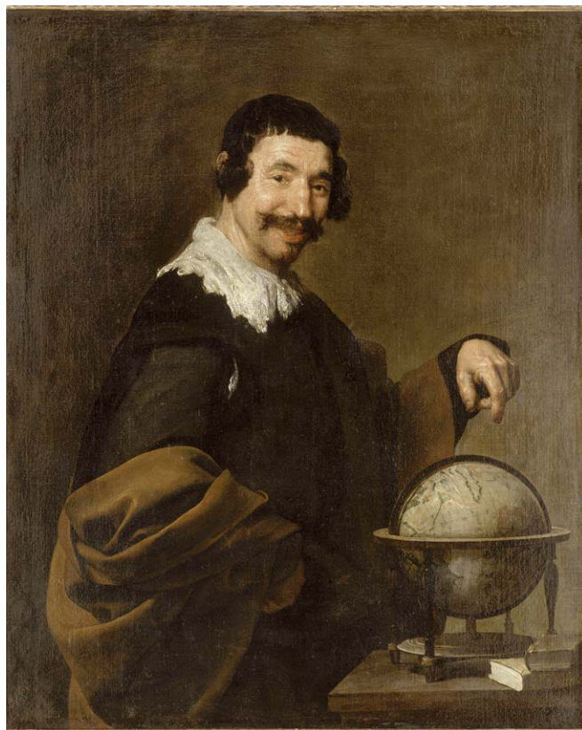
Diego Velázquez, Démocrète (vers 1627-1628), huile sur toile, 101 x 81 cm, Rouen, Musée des Beaux-Arts.