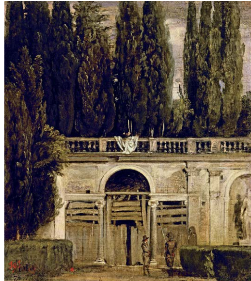
Image de comparaison : Vue des jardins de la Villa Médicis, dit La Serlienne ou Le soir (1630), huile sur toile, 48 x 42 cm, Madrid, Museo Nacional del Prado.