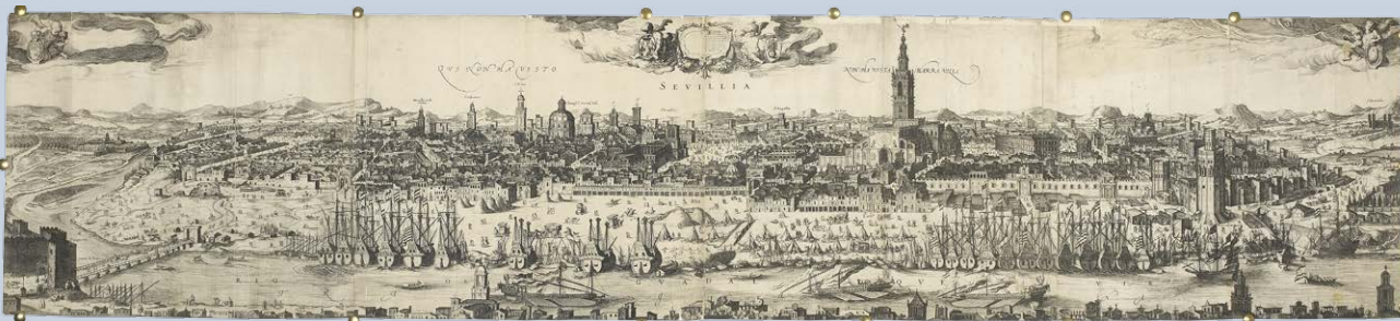
Wynhoutsz Frisius, Vue panoramique de Séville (1617) , Londres, The British Library