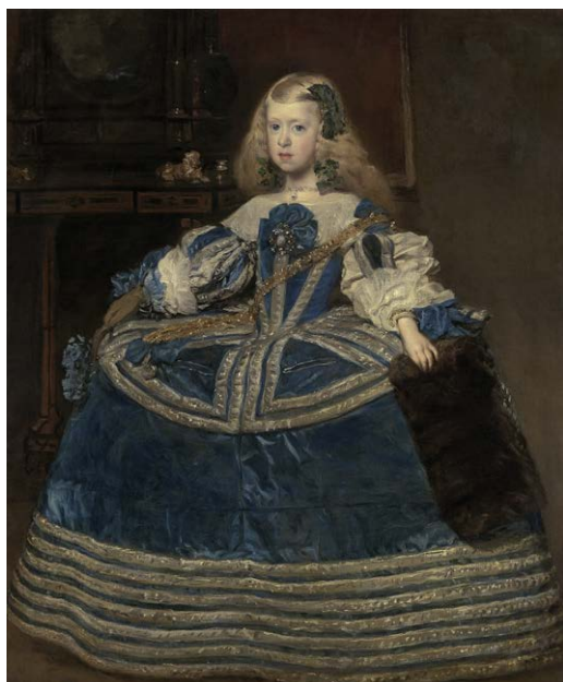
Diego Velázquez, Portrait de l'infante Marguerite en bleu (1659) huile sur toile, 148,5 x 128,5 cm, Vienne, Kunsthistorisches Museum.