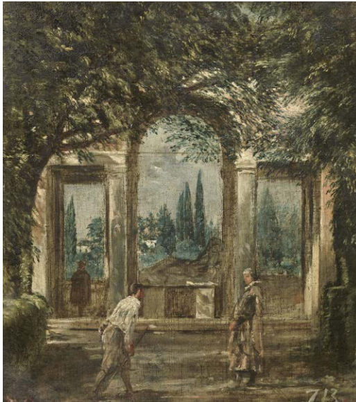
Diego Velázquez, Vue des jardins de la Villa Médicis, dit La Loggia ou Le Milieu du jour (1630), huile sur toile, 44,4 x 38,5 cm, Madrid, Museo Nacional del Prado.