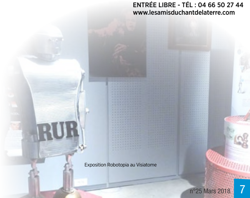
Exposition Robotopia au Visiatome

+ D'INFOS ENTRÉE LIBRE - TÉL. : 04 66 50 27 44 www.lesamisduchantdelaterre.com