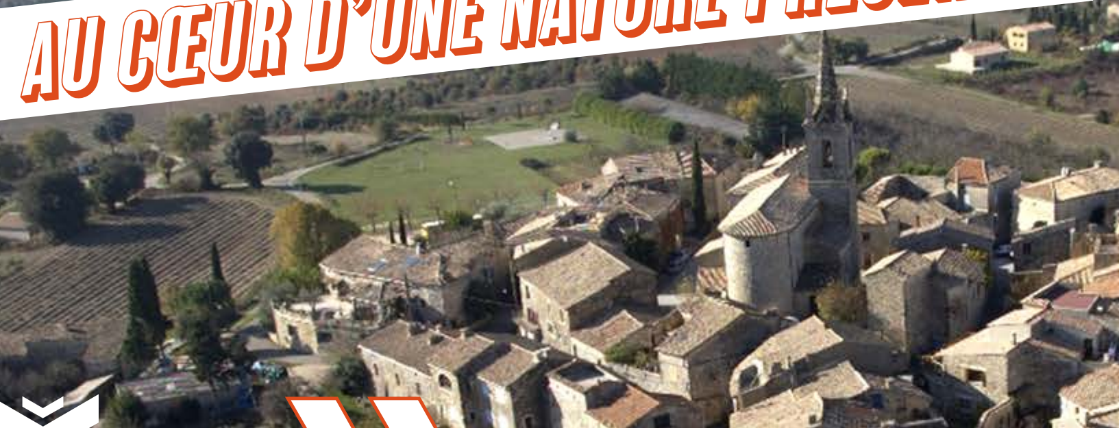
Issirac, vue du ciel