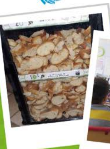
Le gâchi pain : dispositif permettant de montrer la quantité de pain gaspillé.