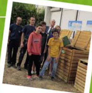
Inauguration d'une aire de compostage des biodéchets.

Au collège de Ventadour une aire de compostage pour les biodéchets de préparation de la restauration scolaire a été inaugurée. Devant la réussite du projet, à la prochaine rentrée scolaire, il s'étendra pour faire participer tous les élèves qui trieront eux-mêmes leurs restes de repas et les transféreront aux composteurs.