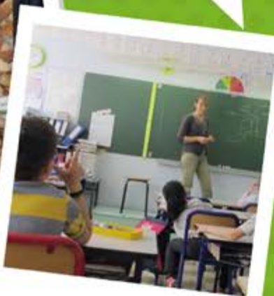
L'animatrice de l'Agglomération du Gard rhodanien expliquant le compostage aux élèves.

Les élèves des 5 classes de l'école d'Orsan, ceux d'une classe de Goudargues ainsi que ceux des 2 classes de Saint-Pons-la-Calm sont sensibilisés au tri sélectif ainsi qu'au recyclage des déchets.