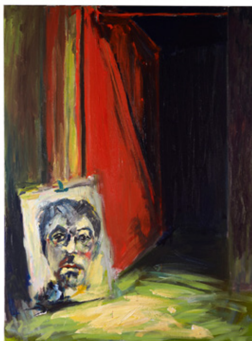
Patrice Giorda, La petite porte rouge , acrylique sur toile, 130 x 97 cm, 2016