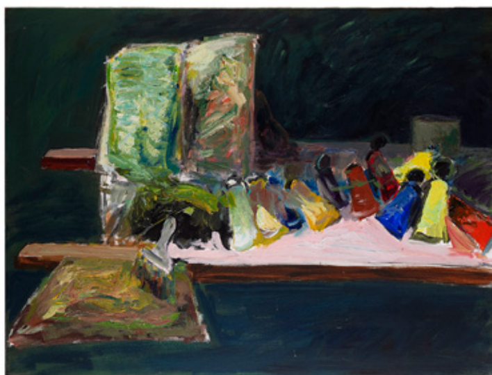
Patrice Giorda, La table de travail n°2 , acrylique sur toile, 97 x 130 cm, 2016