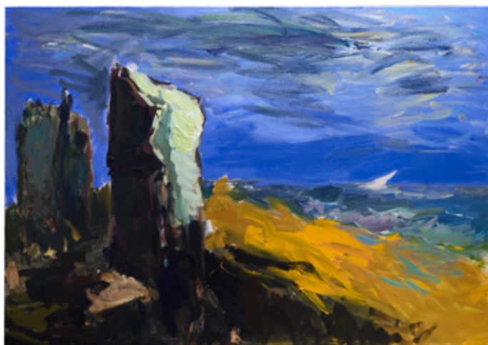
Patrice Giorda, Le Château des Hadleigh n°19 , acrylique sur toile, 114 x 162 cm, 2018