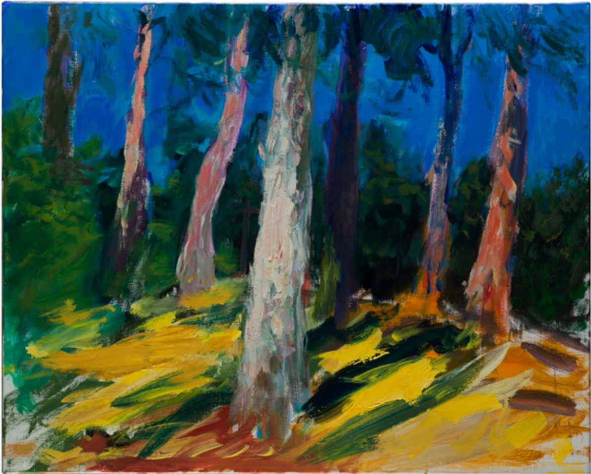
Patrice Giorda, Le mont Carmel , acrylique sur toile, 65 x 81 cm, 2023