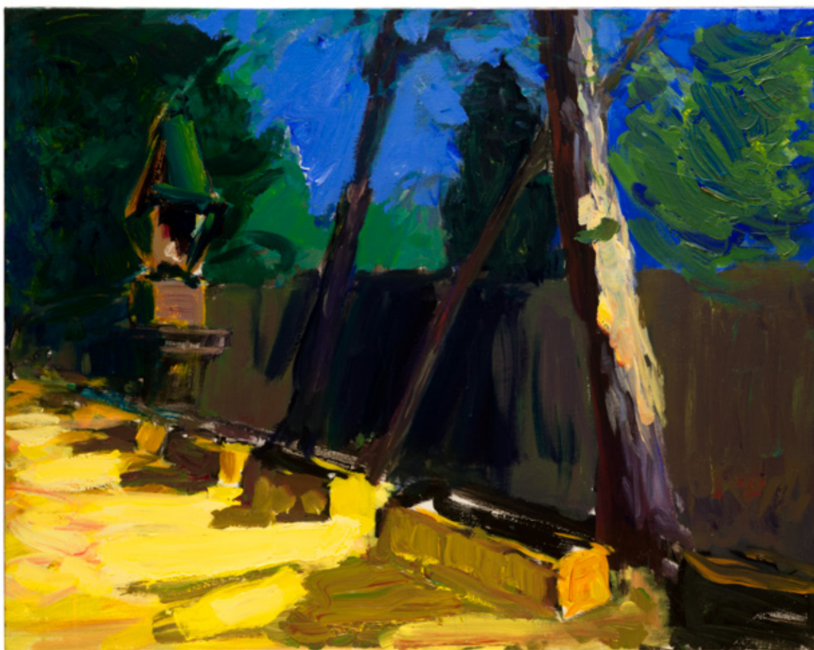
Patrice Giorda, Les Alyscamps II , acrylique sur toile, 73 x 92 cm, 2022

VERNISSAGE le mercredi 10 mai 2023 de 17h à 21h