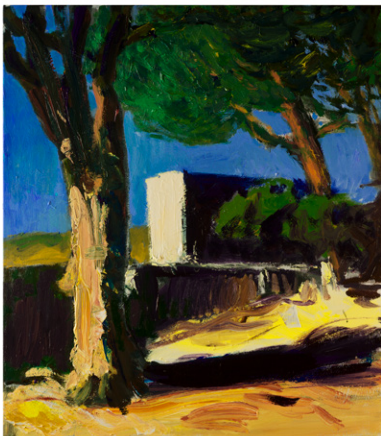
Patrice Giorda, Pins et muret , huile sur toile, 81 x 65 cm, 2022