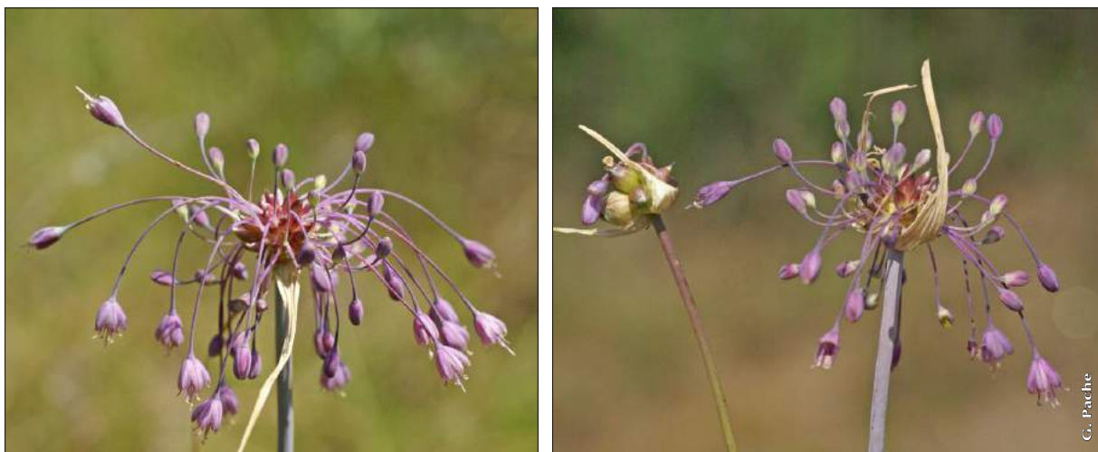
Figure 3 : à gauche, aspect général de A. carinatum ; à droite, comparaison entre A. flexum (individu de gauche) et A. carinatum (individu de droite).

Dans le Jura, la station d' A. flexum à Jeurre signalée par J.-M. Tison a été revue. Des prospections dans ce secteur de la vallée de la Bienne, sur des données d' A. carinatum , ont montré qu'il s'agissait en fait d' A. flexum , et ont permis d'ajouter quelques nouvelles données. Ce dernier y pousse dans des prairies mésophiles à mésohygrophiles, des lisières forestières fraîches et en