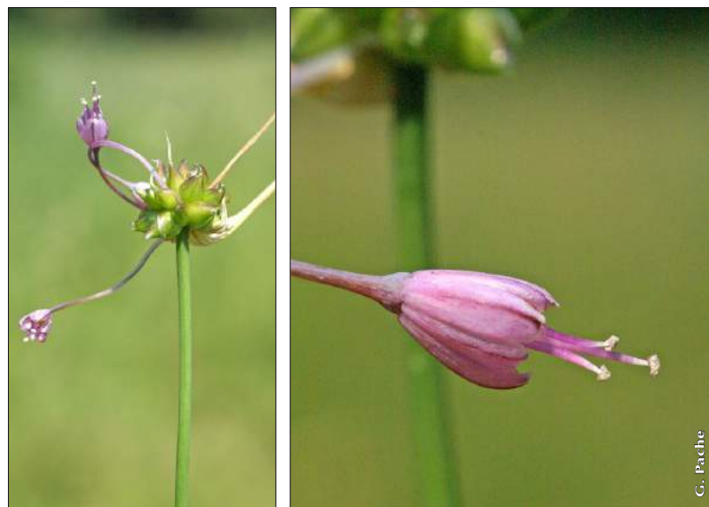
Figure 2 : A. flexum , vue globale (à gauche) et détail d'une fleur (à droite).

Pour A. flexum , le critère le plus simple et constant à l'usage du botaniste de terrain est la tige non pruiteuse (ou parfois très faiblement), verte (figure 2, à gauche) ou