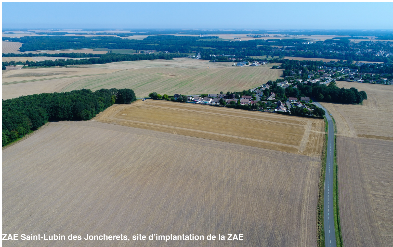
ZAE Saint-Lubin des Joncherets, site d'implantation de la ZAE