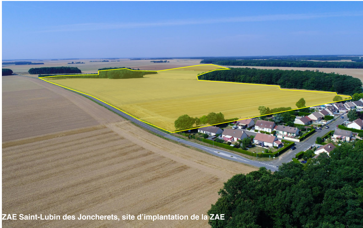
ZAE Saint-Lubin des Joncherets, site d'implantation de la ZAE