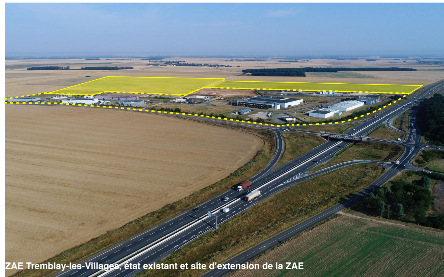
ZAE Tremblay-les-Villages, état existant et site d'extension de la ZAE