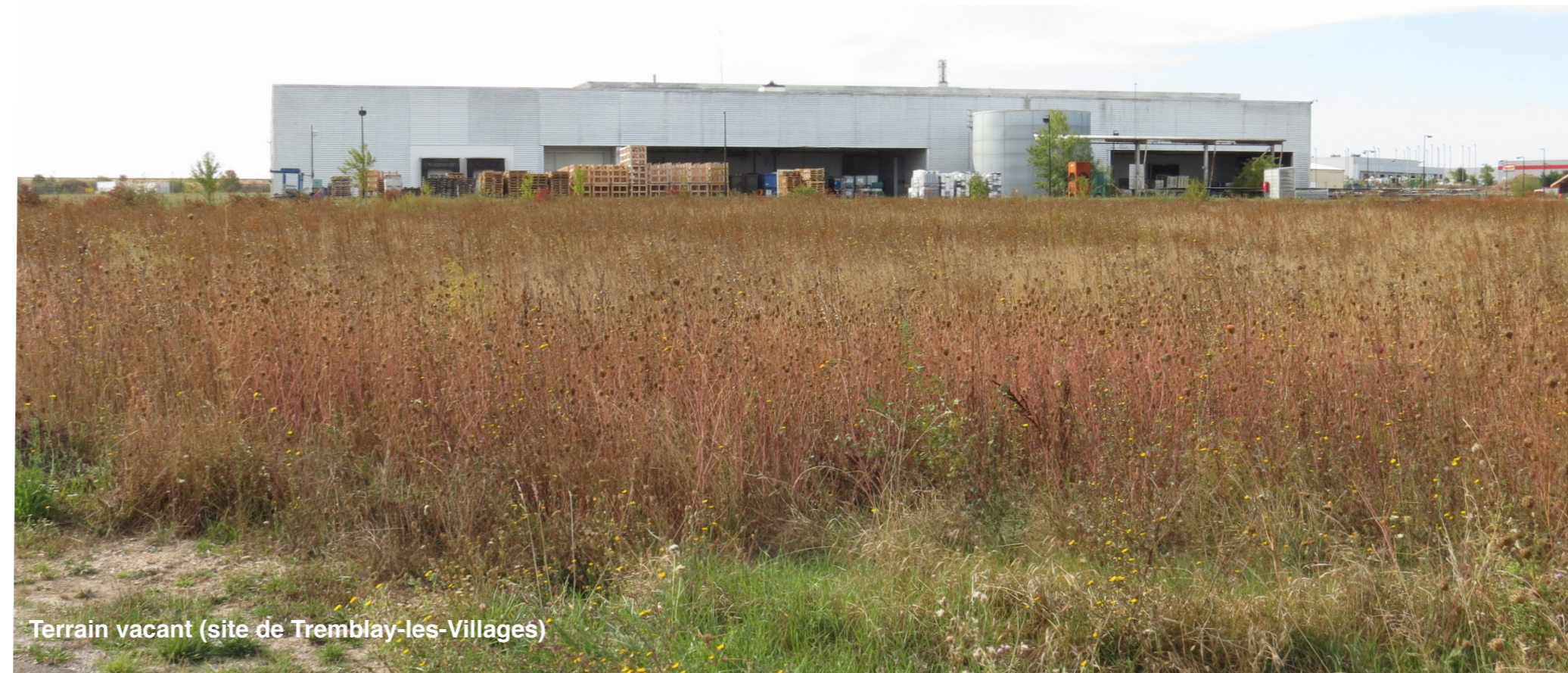
Terrain vacant (site de Tremblay-les-Villages)