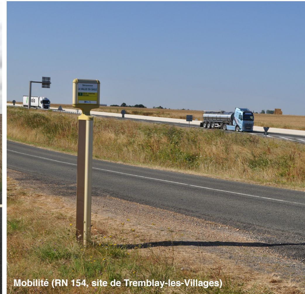
Mobilité (RN 154, site de Tremblay-les-Villages)