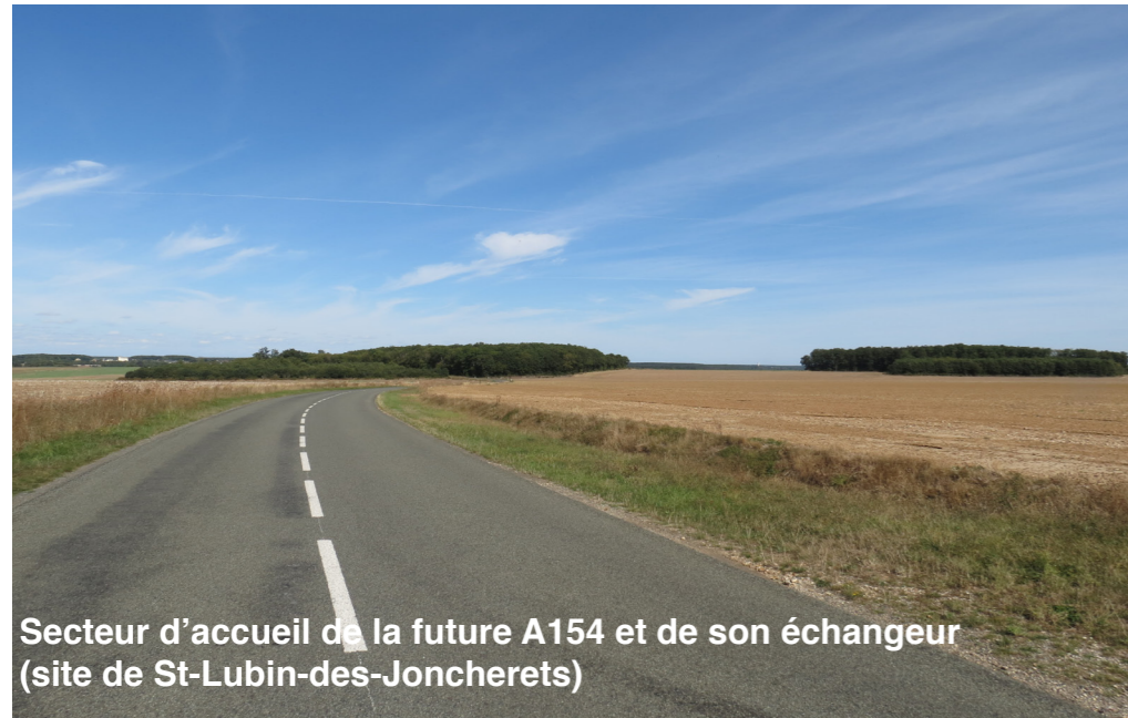
Secteur d'accueil de la future A154 et de son échangeur (site de St-Lubin-des-Joncherets)