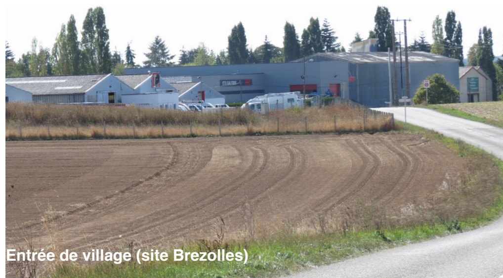
Entrée de village (site Brezolles)