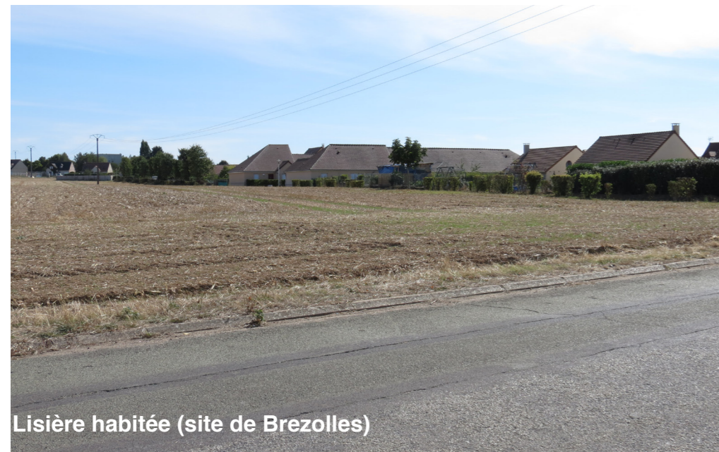
Lisière habitée (site de Brezolles)