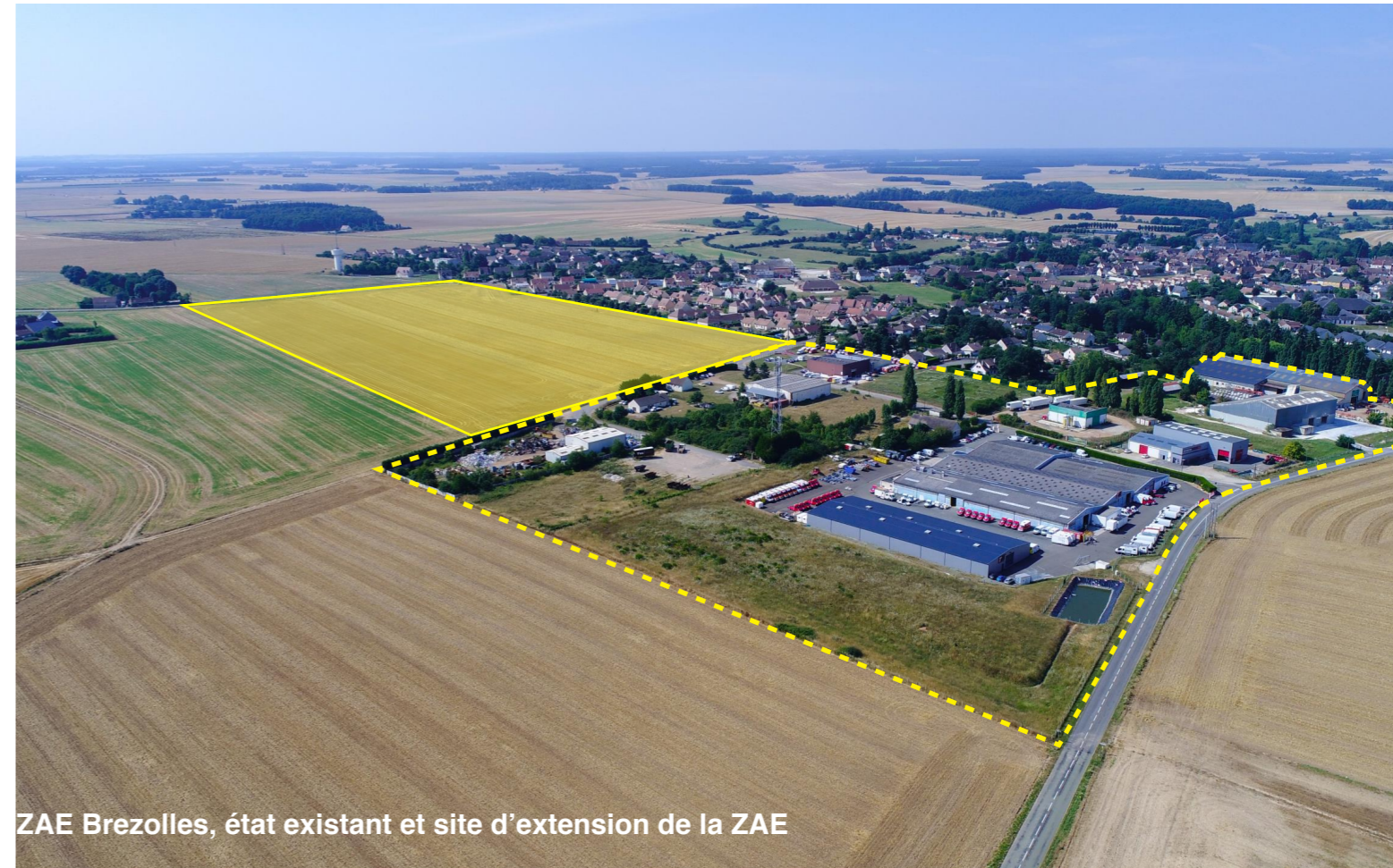
ZAE Brezolles, état existant et site d'extension de la ZAE