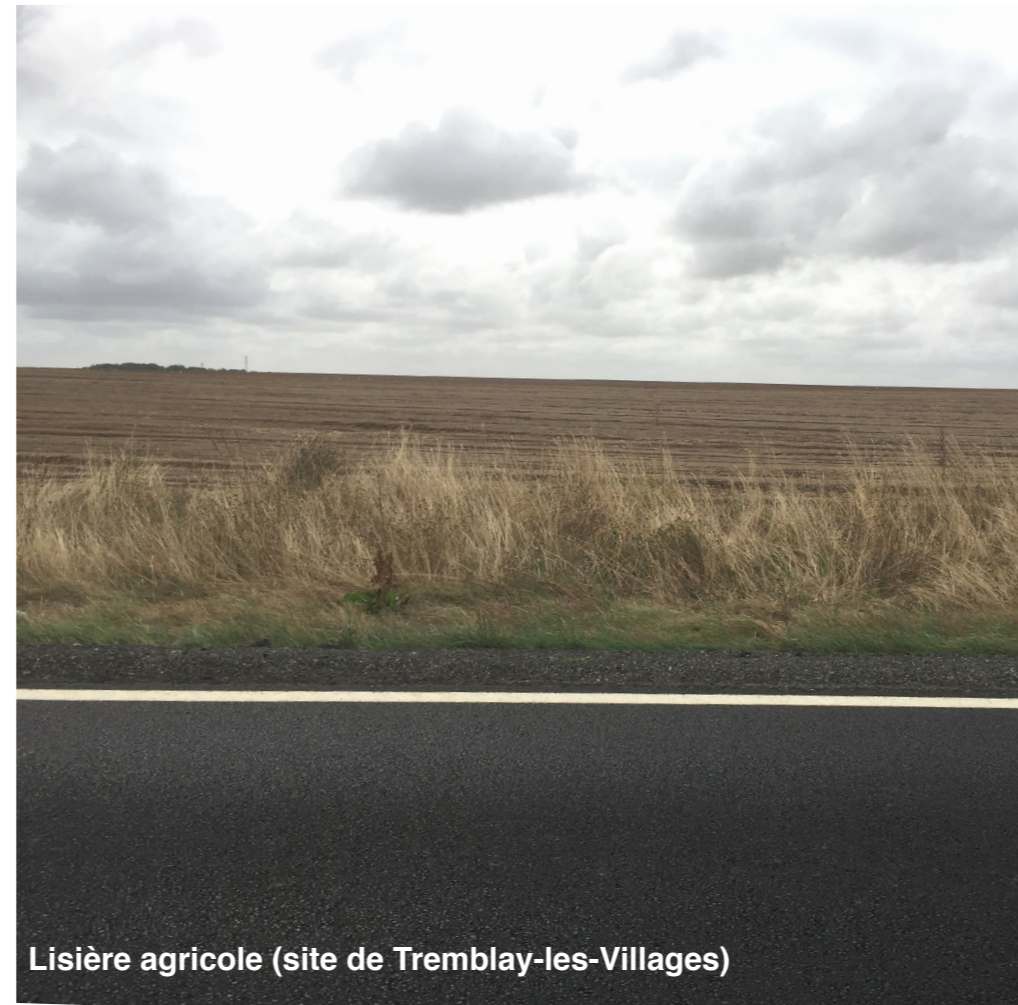
Lisière agricole (site de Tremblay-les-Villages)