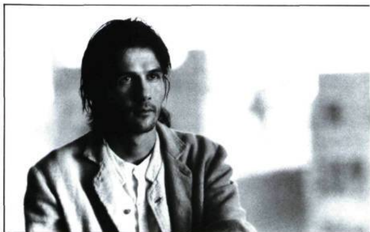
Lothaire Bluteau dans le rôle de Daniel, metteur en scène et interprète de Jésus dans Le chemin de la Croix