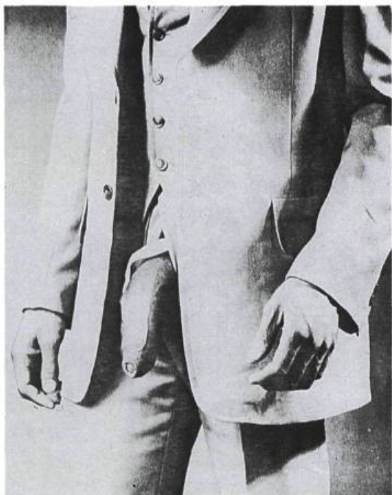
(photo de gauche) Robert Mapplethorpe, Man in Polyester Suit , 1980. Photo N/B. Tiré de E. Barents, Robert Mapplethorpe : Ten by Ten, Photographies , Munich, RFA, Schirren/Mosel, 1988.