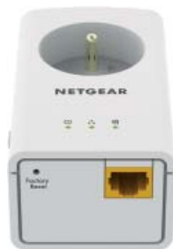
XAV5421 = 1 port