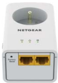
XAV5622 = 2 ports