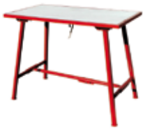
TABLE DE MONTEUR