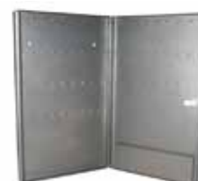
ARMOIRE À CLÉ