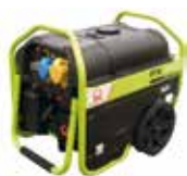
GRUPE ÉLECTROGÈNE ESSENCE 11 L