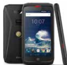
TÉLÉPHONE ACTION X3

TRM1.PACK.BO.NN045 Téléphone Trekker M1 Core.