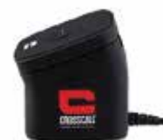
STATION X DOC