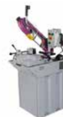
SCIE À RUBAN