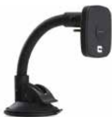
CHARGEUR DE VOITURE