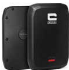
BATTERIE DE SECOURS