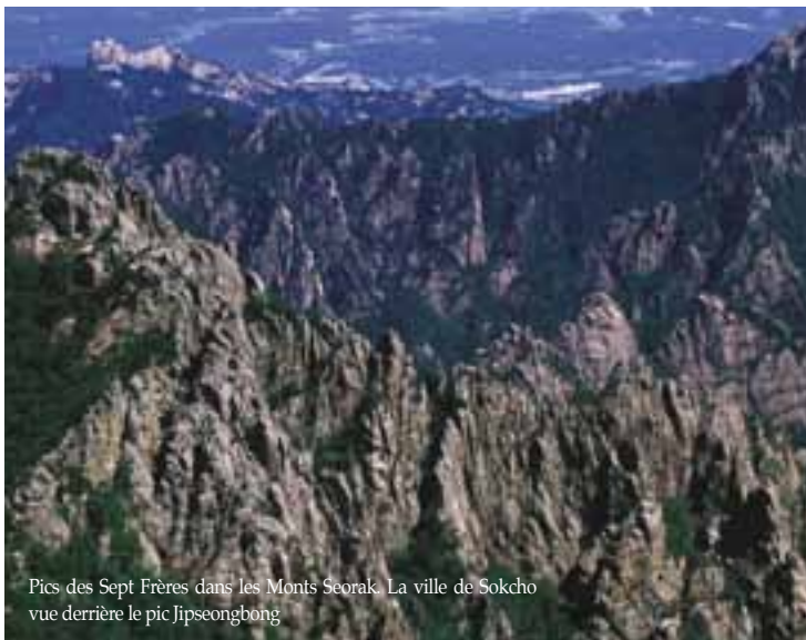
Pics des Sept Frères dans les Monts Seorak. La ville de Sokcho vue derrière le pic Jipseongbong

Daecheongbong : Le pic principal des Seorak s'élève à 1 708 mètres au-dessus du niveau de la mer et depuis le sommet on peut avoir un très vaste panorama des montagnes du massif en un coup d'œil. Plus noble encore en apparence lorsqu'il est vu dans le soleil levant ou couchant, son sommet est marqué par un monument sur lequel est gravé la devise : l'amour de la montagne, l'amour de l'eau . ♦