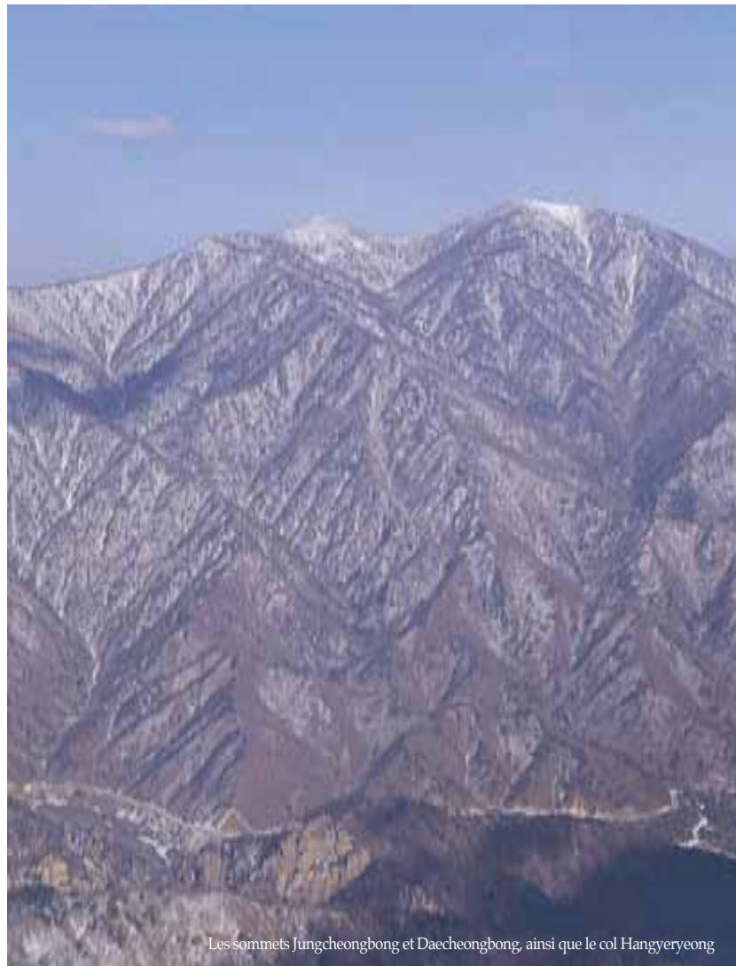
Les sommets Jungcheongbong et Daecheongbong, ainsi que le col Hangyeryeong