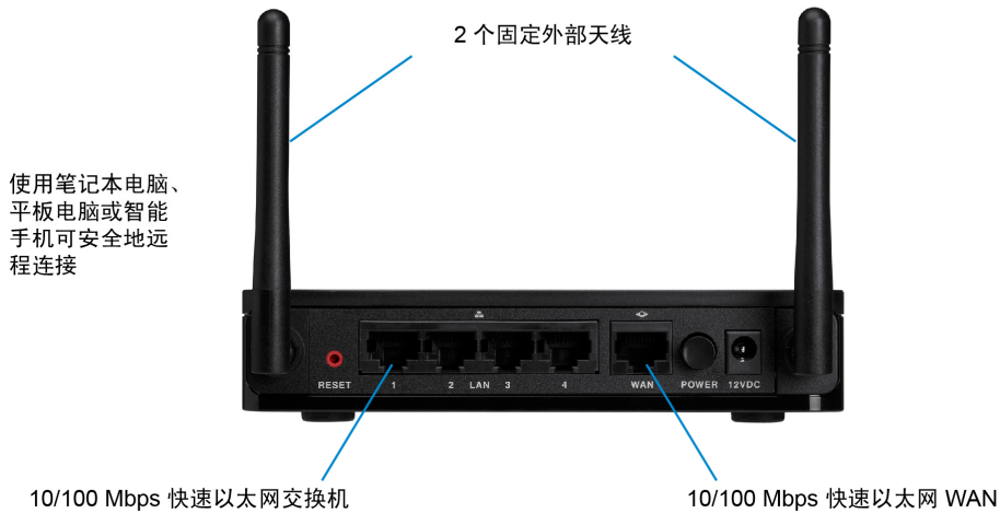
图 3. Cisco RV215W Wireless-N VPN 路由器的典型配置