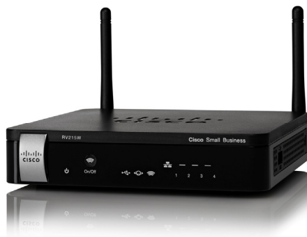
图 1. Cisco RV215W Wireless-N VPN 路由器

Cisco® RV215W Wireless-N VPN 路由器可为小型办公室、家庭办公室和远程位置访问互联网提供简单、经济且高度安全的企业级连接。