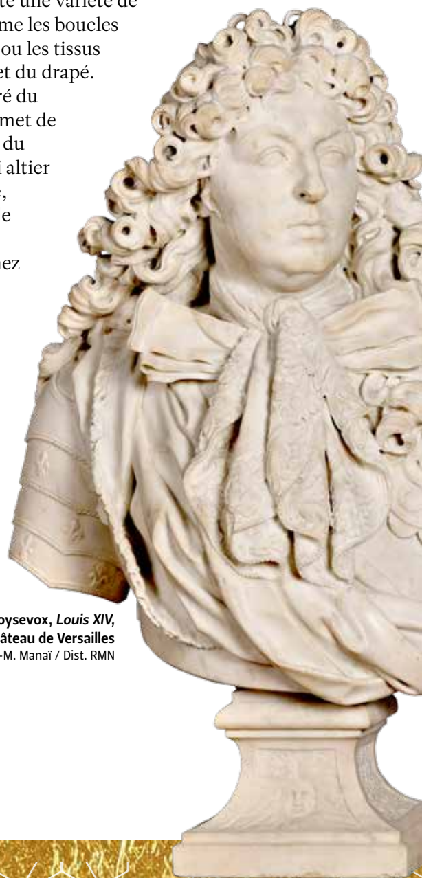
Antoine Coysevox, Louis XIV, roi de France , château de Versailles

Le soleil sur le piédouche et les fleurs de lis sur l'armure révèlent l'identité du modèle royal. Antoine Coysevox sculpte ici un portrait répondant à tous les codes du genre : le buste est coupé à mi-corps, la tête tournée de trois-quarts pour lui insuffler plus de vie ; il présente une variété de textures comme les boucles des cheveux, ou les tissus de l'écharpe et du drapé. Le geste assuré du sculpteur permet de faire émerger du marbre un roi altier et visionnaire, reconnaissable à quelques détails : son nez légèrement aquilin, sa délicate moustache et son front fuyant.