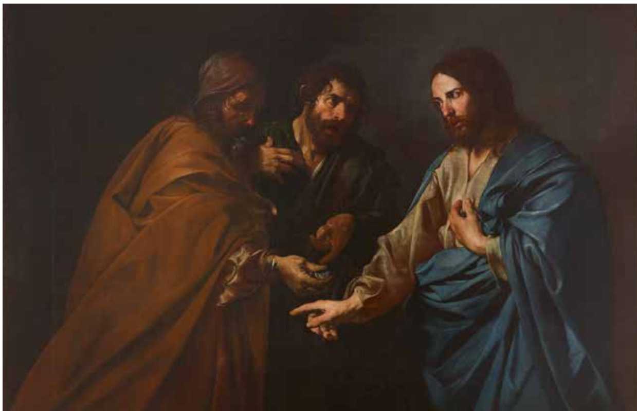
Valentin de Boulogne, Le tribut de César, château de Versailles

Italie, de 1614 jusqu'à sa mort tragique en 1632. Il fait ses armes dans la Rome turbulente des années 1620, marchant dans les pas du Caravage. Considéré par le grand historien de l'art Roberto Longhi comme « le plus énergique et le plus passionné des suiveurs naturalistes de Caravage », Valentin se détache du maître par son style empreint de gravité et de mélancolie. Son corpus restreint, environ soixante tableaux, est tout entier composé d'œuvres d'obédience caravagesque : Valentin multiplie les scènes de genre à fond sombre et les personnages à mi-corps – bohémiennes, rixes, réunions de musiciens –, mais les thèmes religieux n'en demeurent pas moins prépondérants.