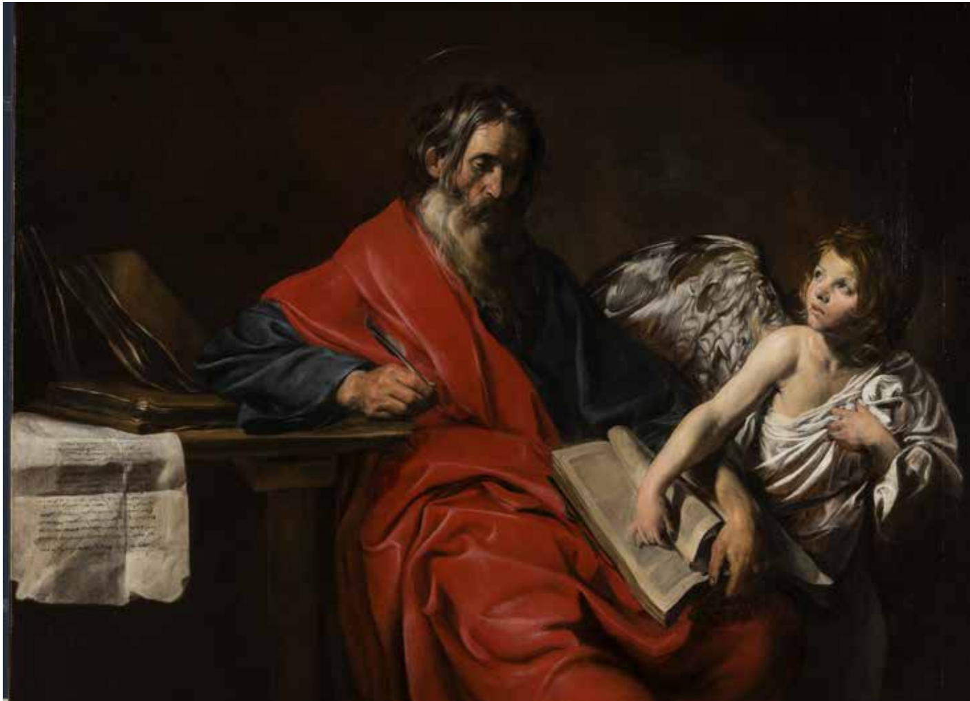
Valentin de Boulogne, Saint Matthieu, évangéliste , château de Versailles

Datant des années 1624-1626, les quatre Évangélistes appartiennent à la même commande mais le nom de leur destinataire ne nous est pas connu. Ces œuvres rentrent dans les collections de Louis XIV en 1670.