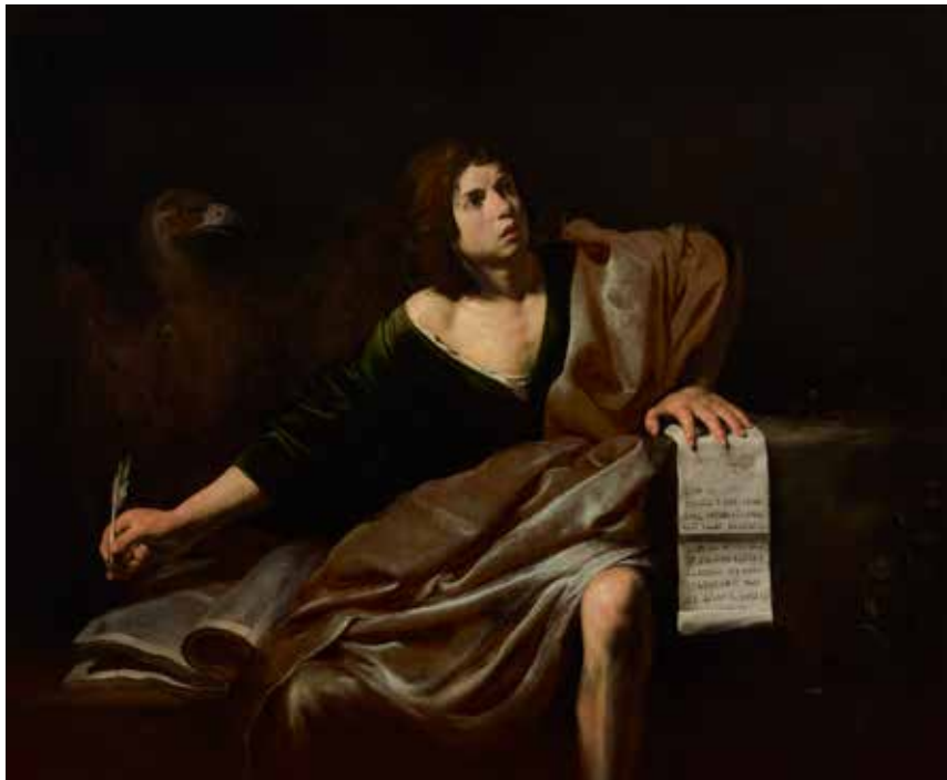
Valentin de Boulogne, Saint Jean, évangeliste , château de Versailles

L'évangéliste, le plus jeune des quatre, est placé dans une puissante diagonale, le regard tourné vers une force extérieure dont le saint tire l'inspiration. Si ce n'est pas la première fois que l'artiste représente l'évangéliste, il accentue ici le contraste clair-obscur et le camaïeu de gris ce qui, avec le texte hébreu, rajoute au mystère de Dieu. Selon la tradition, Jean serait le rédacteur de l' Apocalypse .