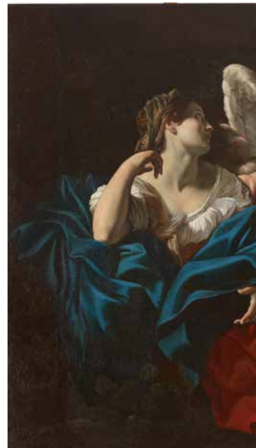
Giovanni Lanfranco, Agar et l'ange , château de Versailles

au XVII e siècle : pour donner satisfaction à Sara, Abraham chasse la servante égyptienne Agar et le fils qu'il a eu de cette dernière, Ismaël. Dans le désert de Bersabée, l'eau vient rapidement à manquer. Aussi Agar dépose-t-elle Ismaël sous un buisson et s'en écarte pour ne pas le voir mourir. Sensible aux cris de l'enfant et aux pleurs de la mère, Dieu leur envoie un ange. Sous le pinceau de Lanfranco, l'ange adolescent, d'une main, touche l'épaule d'Agar, de l'autre désigne la source salvatrice. D'une exécution sommaire, Ismaël s'intercale maladroitement entre Agar et l'ange. Cette étrangeté cependant n'enlève rien à la splendeur de la composition : campée dans un flot de drapés, la figure d'Agar occupe la moitié de l'espace en créant une forte diagonale.