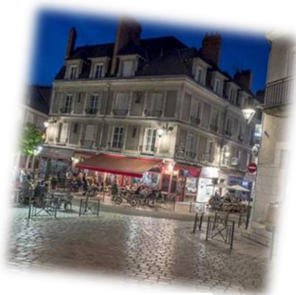
Figure 5 : Blois

Côté musique, rendez-vous aux Doves à Onzain , aux festivals les Candécibels à Candé-sur-Beuvron, à H2O et à Jazz'In Cheverny .