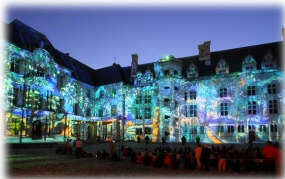
Figure 4 : Son et lumière au château royal de Blois