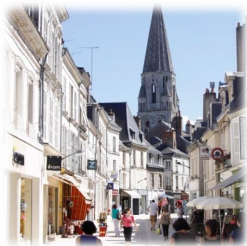
Figure 8 : Vendôme

Depuis la gare TGV de Vendôme-Villiers sur Loir, on rejoint Paris en moins de 45 minutes. Une véritable aubaine pour ceux d'entre-nous qui souhaitent conserver un pied à Paris ! Télétravail, déplacements professionnels... tout est possible, et en vivant le rêve de la campagne. Que demander de plus ?