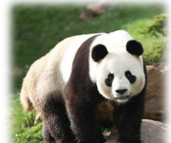
Figure 1 : Zoo de Beauval