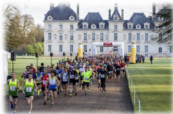
Figure 7 : Marathon au château de Cheverny

Vous êtes sportif ? Inscrivez-vous aux nombreux trails et marathons organisés, notamment à Cheverny et lancez-vous sur le Macadam, course multi-épreuves à Blois. Enfin, suivez les exploits de l'ADA Blois, notre équipe de basket en pro B !