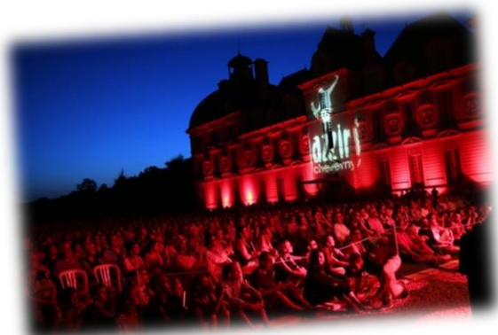
Figure 6 : festival Cheverny

Féru de culture ? Incontournable, la programmation culturelle très éclectique du du Château de Chambord et son domaine. A Blois , les rendez-vous de l'Histoire feront votre bonheur. Amateur de BD, c'est à BD Boum que nous vous donnons rendez-vous !