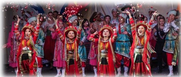
Figure 9 : festival de Montoire

Côté musical d'ailleurs, vous aurez le choix ! Avec les Rockomotives ou encore Guitares au Gré du Loir. Imaginez la route que vous auriez à faire si vous deviez revenir tous les weekends.