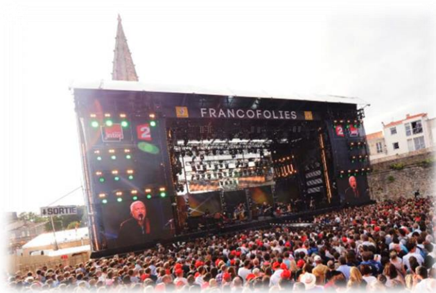
Figure 3 : Les copains d'abord aux francofolies

Vous êtes plutôt sportif ? Venez assister aux Championnats de France d'équitation, et inscrivez-vous aux nombreux trails et marathons organisés, notamment à Cheverny !