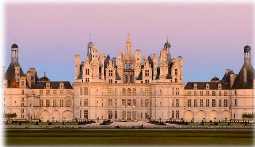
Figure 2 : château de Chambord

Vous êtes plutôt sportif ? Venez assister aux Championnats de France d'équitation, et inscrivez-vous aux nombreux trails et marathons organisés, notamment à Cheverny !