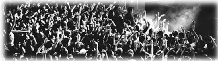
Figure 10 : Rockomotive

Venez également découvrir un paysage typique dans la région, les troglodytes au travers de maisons troglodytiques dans le village de Trô non loin de Blois, mêlant terrasses étagées, grottes et d'autres lieux insolites.