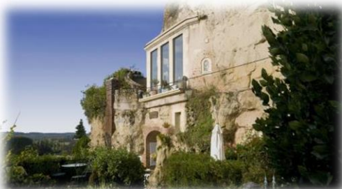
Figure 11 : troglodytes de Trô

Venez également découvrir un paysage typique dans la région, les troglodytes au travers de maisons troglodytiques dans le village de Trô non loin de Blois, mêlant terrasses étagées, grottes et d'autres lieux insolites.