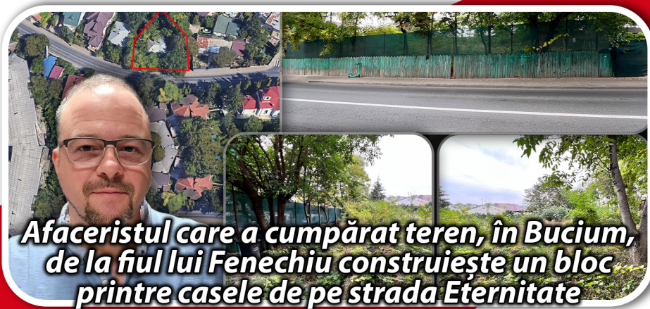
Afaceristul care a cumpărat teren, în Bucium, de la fiul lui Fenechiu construiește un bloc printre casele de pe strada Eternitate