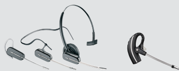
SAVI 440/445 Convertible