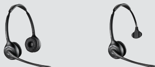
SAVI 420 Modèle serre-tête (binaural)