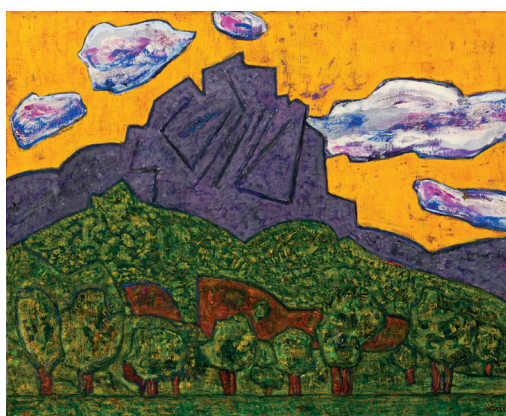
Vincent Bioulès, Le Pic Saint Loup face Nord , huile sur toile, 81x100cm, 2021, © Pierre Schwartz