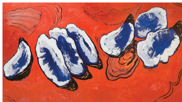
Guy de Malherbe, Sept huîtres sur fond rouge , 2020, huile sur toile, 100x180cm

Depuis 2019, Guy de Malherbe a développé un important ensemble d'oeuvres, rassemblées sous le nom de « Reliefs ». Un mot qui évoque encore les rochers et les paysages des peintures précédentes, autant qu'il désigne les reliefs de repas qui composent cette exposition : des huîtres, des côtelettes d'agneau et des assiettes d'artichauts. Les reliefs de repas n'est sont que l'aboutissement naturel des dix dernières années de recherche : les huîtres ne sont-elles pas un organisme qui devient un minéral ? Une forme de vie qui devient pierre ?