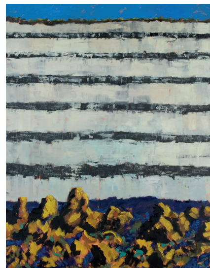
Guy de Malherbe, Falaise , huile sur toile, 250x200cm, 2013