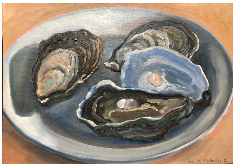
Guy de Malherbe, Huitres , huile sur papier marouflé sur bois, 19x27 cm, 2022