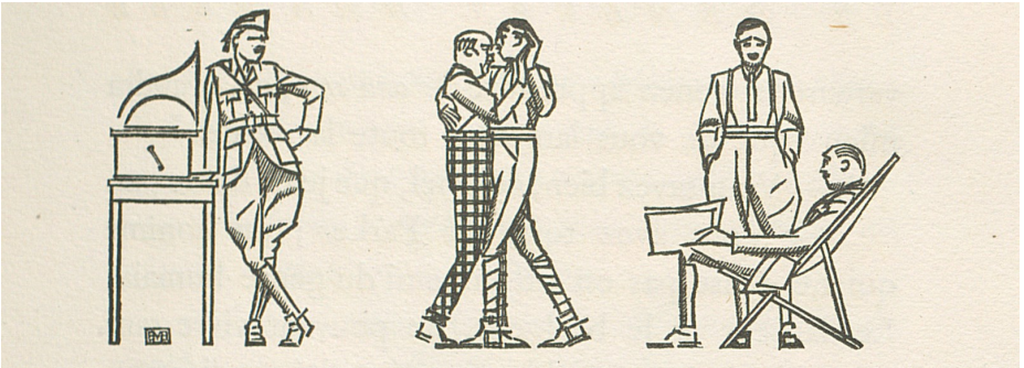
André Maurois, Le Général Bramble , Bernard Grasset, Paris, 1922. Nsd 10320 Dessins originaux de Bernard Boutet de Monvel gravés sur bois par Gasperini

Jusqu'à la Seconde Guerre mondiale, les succès et les honneurs pleuvent. Grâce peut-être à une habile publicité, les journaux littéraires et mondains ne cessent de s'intéresser à Maurois. À côté d'œuvres importantes, La Vie de Disraéli , Climats , Le Cercle de famille , et de la première série de ses biographies, Byron , Lyautey , Tourgueniev , Voltaire , Chateaubriand , il écrit quantité d'essais, d'articles, et fait d'innombrables conférences, en France, en Angleterre et aux États-Unis.