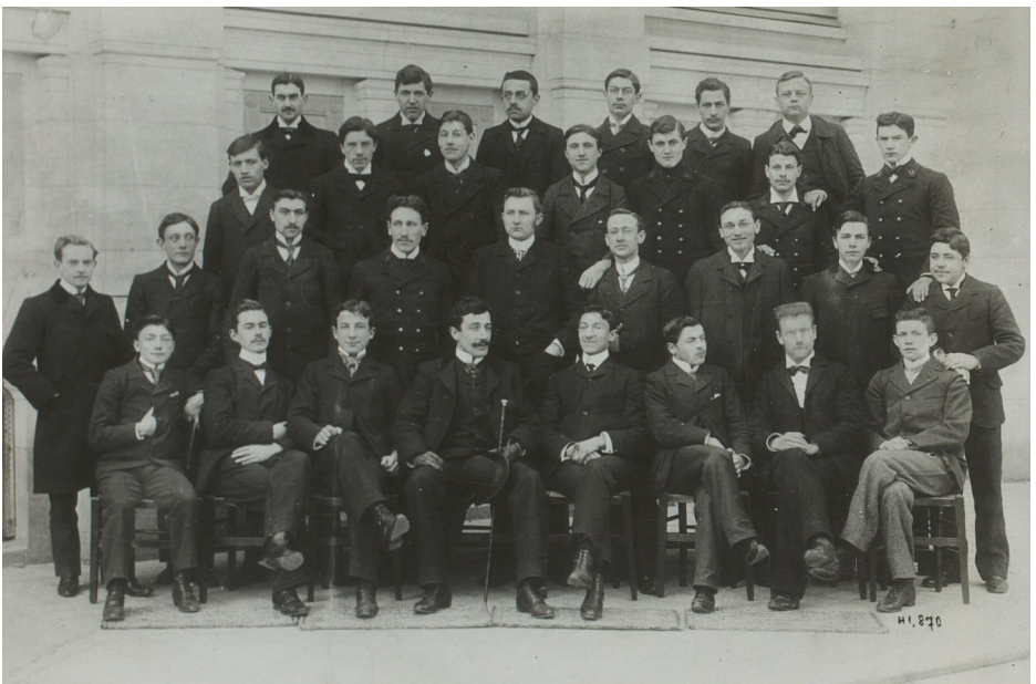
Lycée Corneille, juillet 1902. Classe d'Alain. Au milieu, à gauche d'Alain, André Maurois. Ms 8505

Émile Herzog compose ses premières œuvres (théâtre, contes et nouvelles) alors qu'il est encore lycéen. La plupart de ces écrits de jeunesse, parfois inachevés, sont perdus ou restent inédits. Quelques-uns ont été publiés souvent longtemps après leur composition.