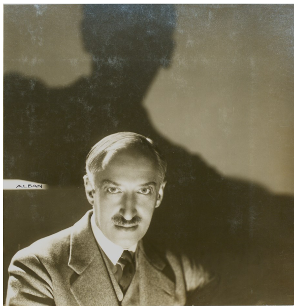
André Maurois, 1932. Ms 8505

C'est sur la base de ce don initial, dont le classement est désormais bien avancé, complété par le fonds des imprimés deux achats exceptionnels de manuscrits d'André Maurois au cours de l'été 2017, la bibliothèque de l'Institut rend hommage au célèbre écrivain et académicien disparu il y a cinquante ans, le 9 octobre 1967.