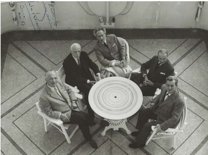
Festival international du film, Cannes, mai 1957. De gauche à droite : Jules Romains, André Maurois (président du jury), Jean Cocteau (président d'honneur), Maurice Genevoix et Marcel Pagnol. Ms 8505