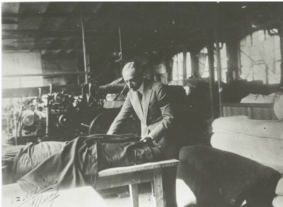
André Maurois en 1924, à El-boeuf, dans la fabrique familiale. Ms 8505

« Bernard Quesnay était un roman sur la vie industrielle, développement de la nouvelle que j'avais publiée jadis sous le titre : La Hausse et la baisse . Comme Véronèse dans certains de ses tableaux, j'y figurais deux fois :