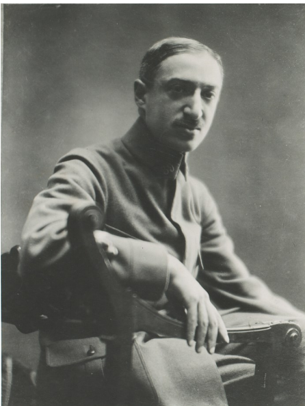
Maurois en 1914. Ms 8505

Ce premier succès se confirme en 1922, avec les Discours du docteur O'Grady dont le personnage figure dans les Silences . Tout au long de sa vie d'auteur, en effet, Maurois aime « suivre » les personnages qu'il a créés. Avec les Nouveaux Discours du docteur O'Grady (1950), André Maurois-Aurette retrouve une dernière fois le docteur O'Grady, échangeant avec lui des vues sur les problèmes contemporains.