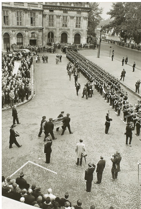
À sa mort, en 1967, André Maurois reçoit l'hommage de funérailles quasi nationales à l'Institut de France. Ms 8505